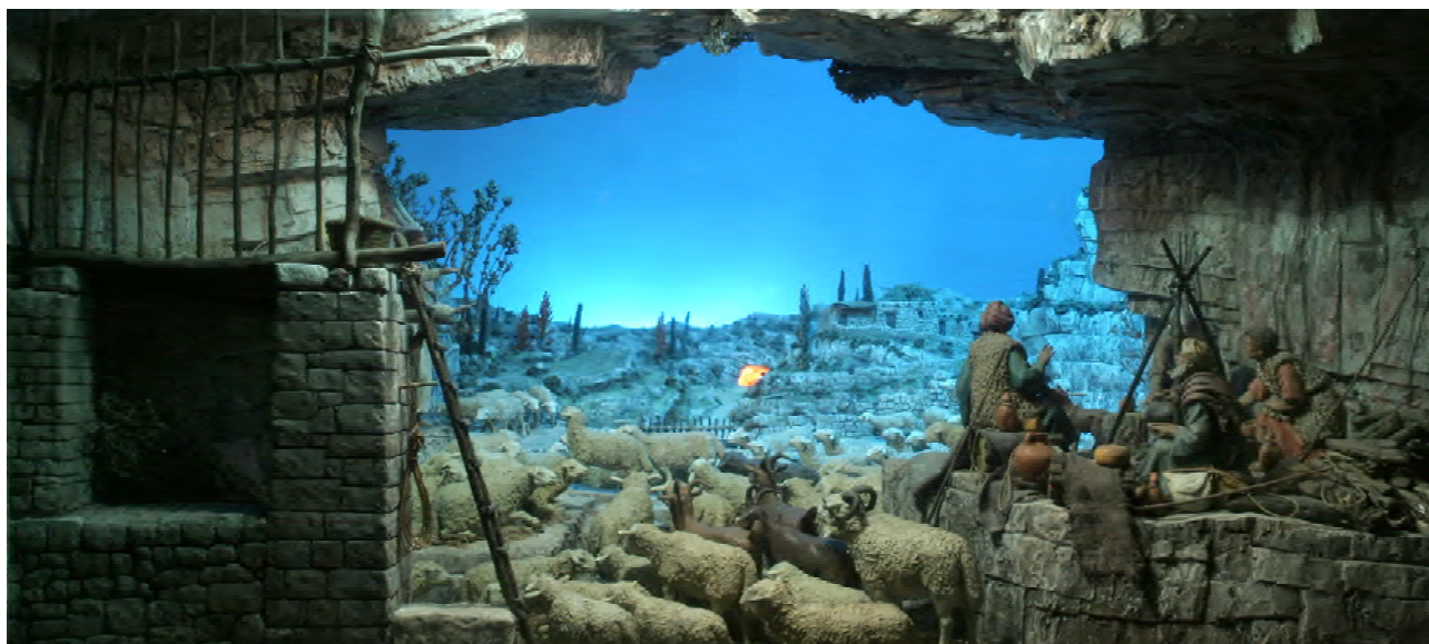
Anunciació dels pastors (1962)