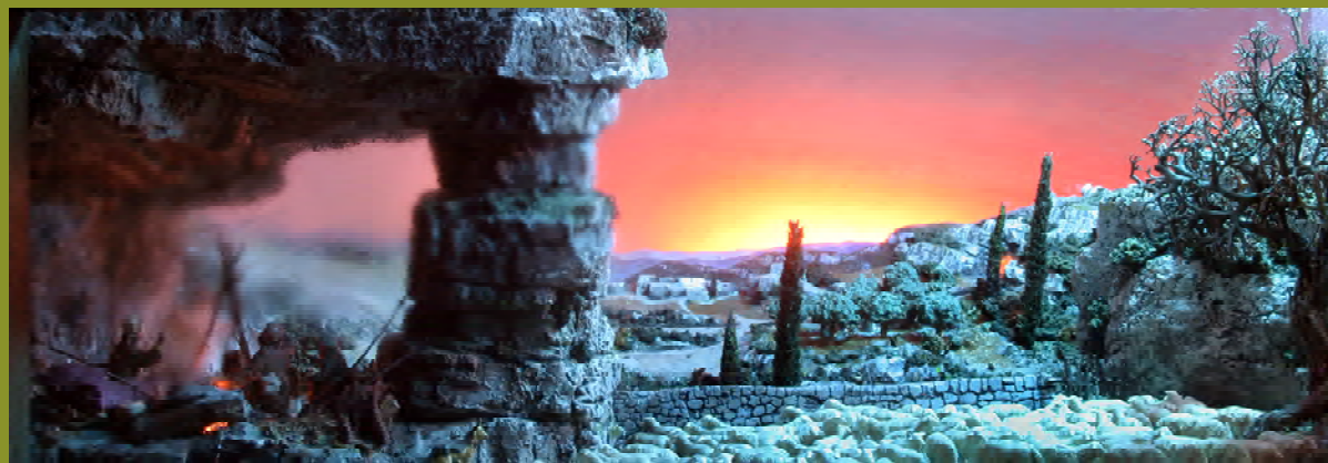
ANUNCIACIÓ ALS PASTORS (1992) .