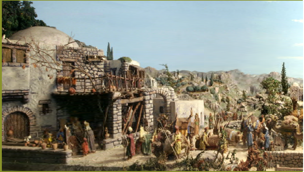
ADORACIO DELS REIS (1957)