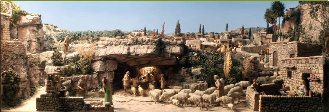
ADORACIÓ DELS PASTORS (1994)