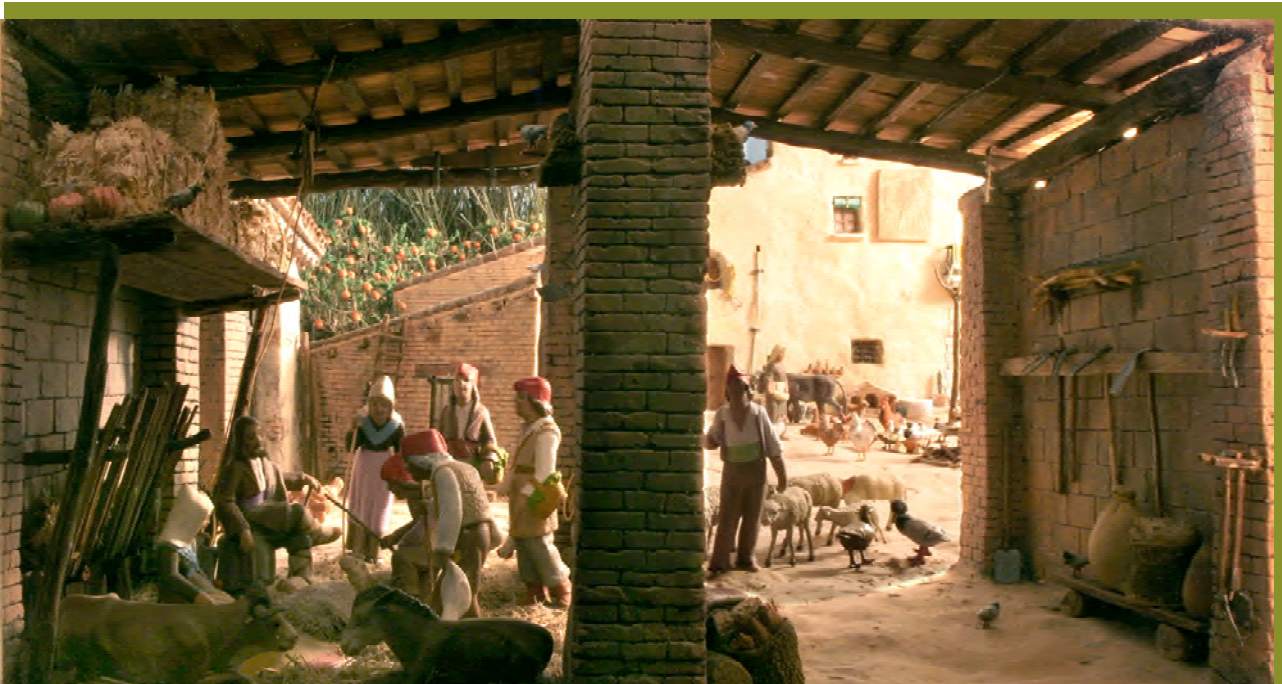
NAIXEMENT (1955) (Figures de Lluís Carratalà i Vila).