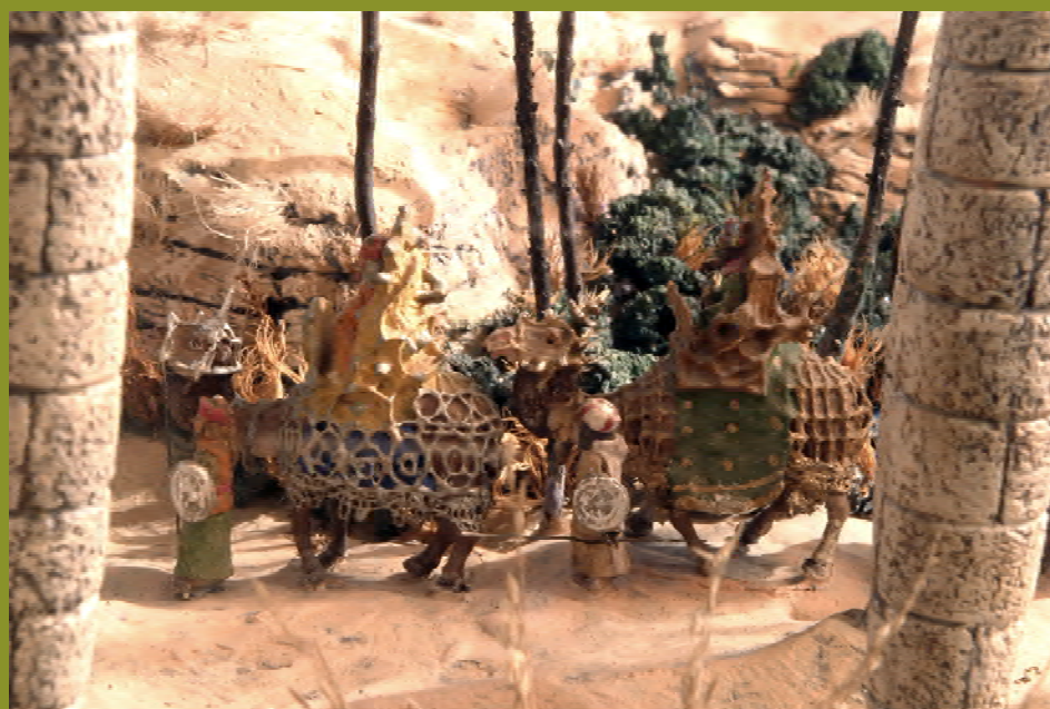
DETALL DELS REIS. Modelats per Joan Mestres