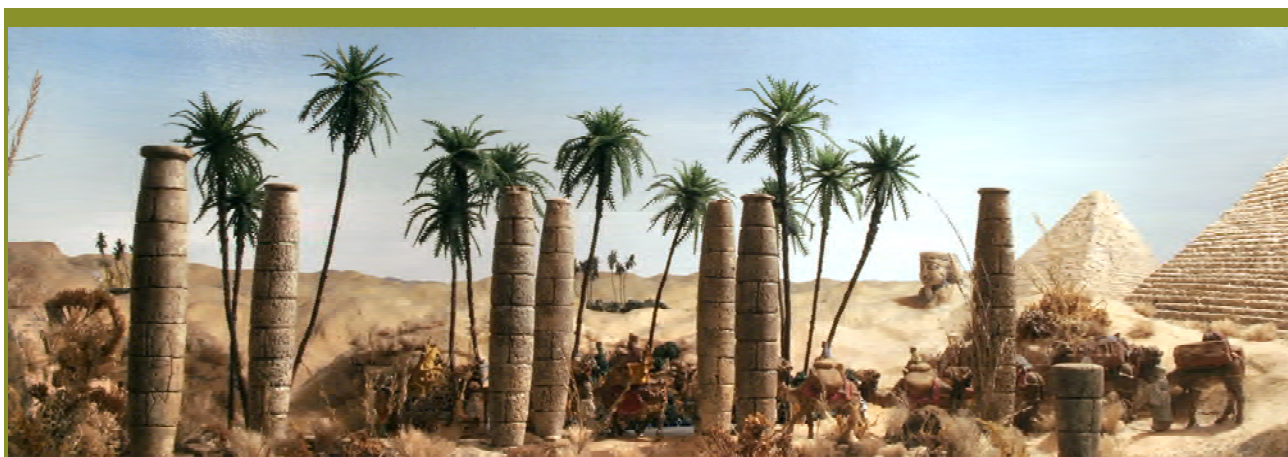
CAVALCADA DELS REIS (1949)