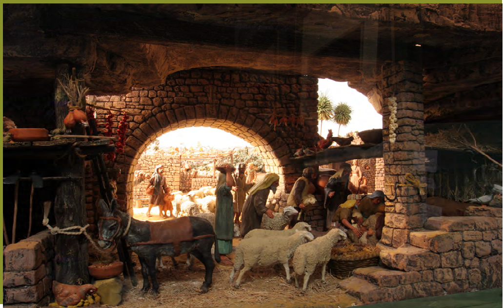
ADORACIO DELS PASTORS (2007)