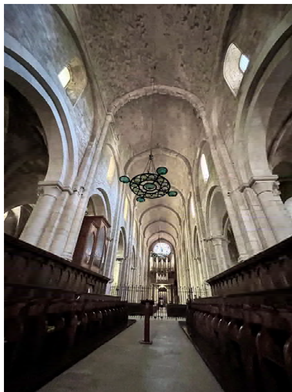
Interior de l'església de Poblet.

A la llum de l'indicat fins aquí, és prou plausible que la construcció de l'església es realitzés en diferents fases; alguns autors fins i tot ofereixen una cronologia concreta per a cada fase: entre 1170-1196 (capçalera), 1196-1276 (creuer i naus longitudinals), 1276-1300 (atri) i entre 1316-1348 pel que fa a la reestructuració del costat sud del temple. 46 Aquesta proposta cronològica ens podria semblar més o menys vàlida, en tant que pretén ser -suposem- orientativa, si bé no escatim la raó per la qual els autors de la proposta utilitzen com a data frontissa l'any 1276 quan el regnat de Jaume I arribi a la seva fi. En funció del que hem vist aquí, l'església ja devia estar acabada de molt abans.