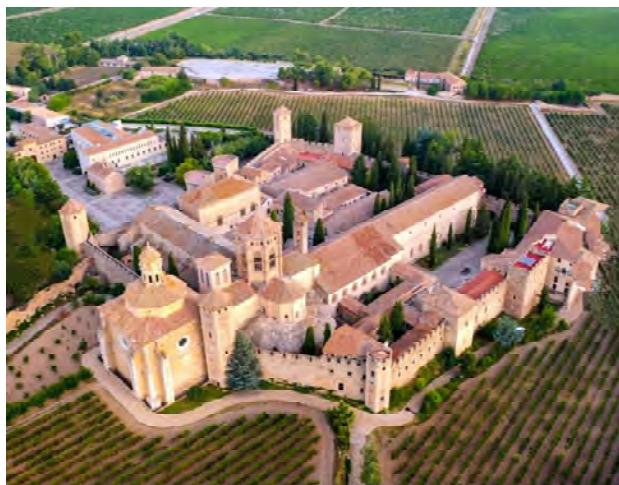
Vista aèria del Monestir de Poblet

Darrerament, una de les tasques dutes a terme en el marc del Projecte desenvolupat a l’Institut de Historia del Centro de Ciencias Históricas y Sociales de Madrid ha estat confeccionar una base de dades de tots els donatius d’aquest tipus que poden ser documentats, no sols als testaments (i a les consegüents publicacions sacramentals), sinó també en altres documents de donació “inter vivos”, sempre que expressin la relació amb obres d’esglésies. Aquesta tasca l’hem feta a partir, bàsicament, de les fonts editades (cartularis, diplomataris, col·leccions de pergamins...) i també a partir de les referències que figuren en treballs publicats. La base de dades s’ha nodrit de tantes edificacions com és possible referenciar a Catalunya entre 1050-1299. 2 La llista resultant és força extensa i està configurada per esglésies majors (catedrals, canòniques) i menors (parròquies, capelles), i també per establiments monacals. Un dels que compta amb una sèrie de dades més nodrida és Poblet, monestir que fou fundat pel comte Ramon Berenguer IV a mitjan segle XII a l’anomenat hortus populeti (hort envoltat d’albers) amb monjos del Cistell. En la present avinentesa, hem triat posar el focus damunt el monestir de la Conca per a una anàlisi més al detall dels donatius “ad opera” que s’hi relacionen.