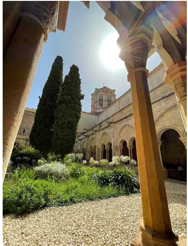
Vista del claustre major de Poblet

Cas a banda és l'hospital que promocionà i costejà Bernat de Granyena, a partir de l'important deixa que va fer. La seva construcció s'inicià el 1207 i, segons Altisent, 51 degué restar acabat en poc temps, si més no en funció de les deixes d'altra mena que es registren amb posterioritat a les del fundador.