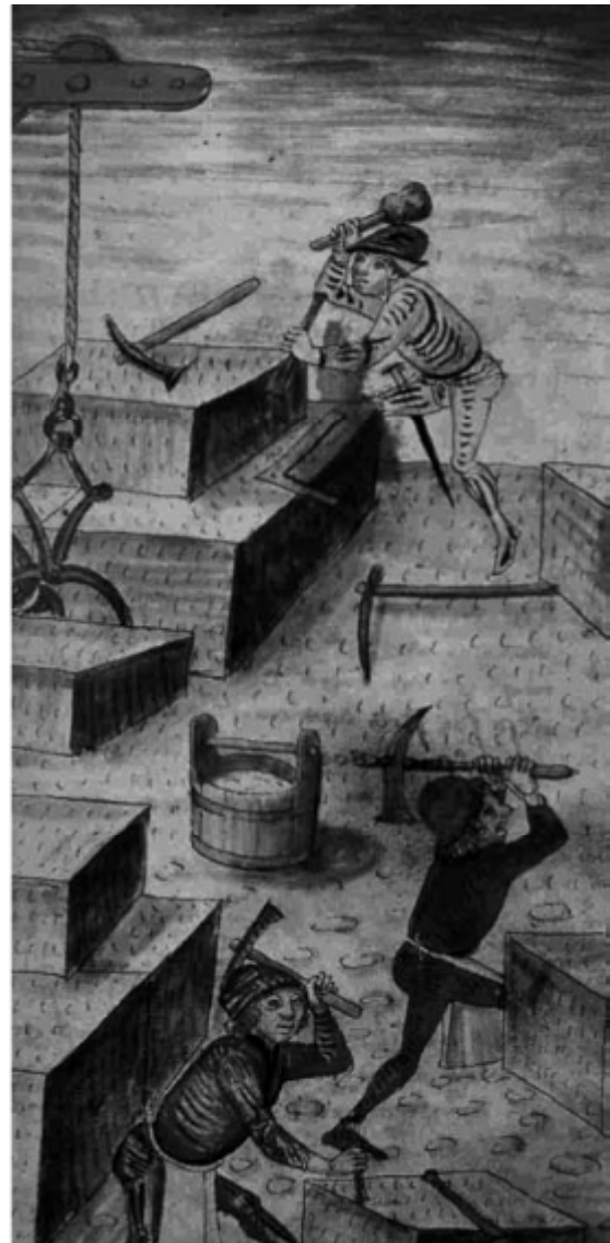
Picapedrers treballant (Quadern de Villard deHonnecourt, s. XIII).

A banda d'aquests esclaus, una obra monumental com la que ens ocupa exigia tenir a disposició molts treballadors, i no sols picapedrers, sinó també fusters, escultors... A propòsit d'això, Altisent donava per suposada la col·laboració dels mateixos monjos en les obres, 31 un punt de vista posat recentment en qüestió per part de l'historiador de l'art Carles Sánchez, per a qui la participació dels monjos