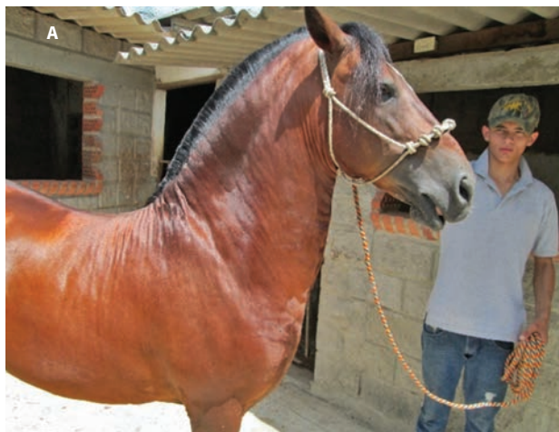
Figura 1. A. Adiposidad regional en un caballo criollo colombiano con CC de 8. Al parecer, existe una predisposición genética en nuestra raza a la acumulación excesiva de grasa en el borde dorsal del cuello. B. La falta de tono en el ligamento nucal, junto al peso excesivo del tejido graso acumulado, determina la deformidad del borde dorsal del cuello, dando un aspecto antiestético.