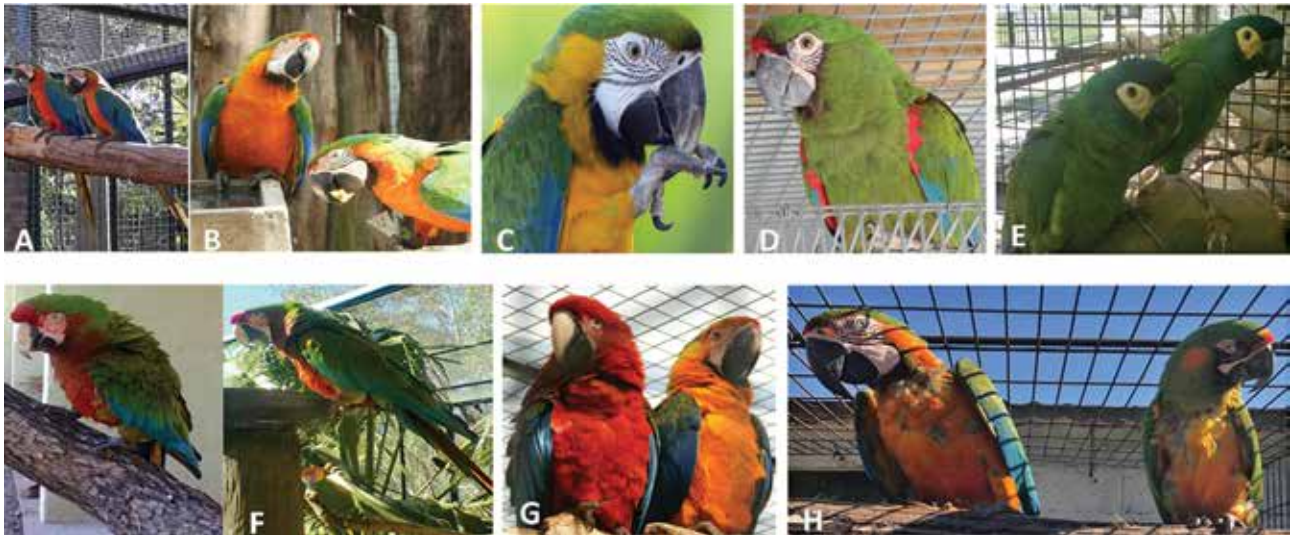
Figura 1. Guacamayos híbridos pertenecientes al programa de manejo reproductivo del Centro de fauna “La Esmeralda”, Santa Fe, Argentina

*A. Guacamayo Catalina ( Ara ararauna por Ara macao macao ), B. Guacamayo Arlequín ( Ara ararauna por Ara chloropterus ), C. Guacamayo Miligold ( Ara ararauna por Ara militaris bolivianus ), D. Guacamayo ( Ara rubrogenys por Ara severus castaneifrons ), E. Guacamayo Santa Fe ( Ara maracana por Ara auricollis ), F. Guacamayo Cálido ( Ara chloropterus por Ara militaris bolivianus ), G. pareja mixta: Ara chloropterus emparejado con Guacamayo Catalina, H. Pareja de Guacamayo Arlequín enyuntado con un Guacamayo Maui Sunset ( Ara rubrogenys por Ara ararauna ).