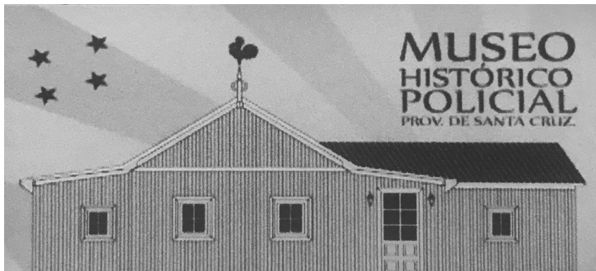
Figura 7. Folletería del museo policial de Santa Cruz.