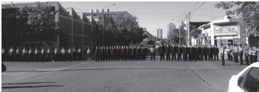
Figura 1. Inauguración del museo “Comisario Inspector Luis F. Dewey” diciembre del 2011. Neuquén.