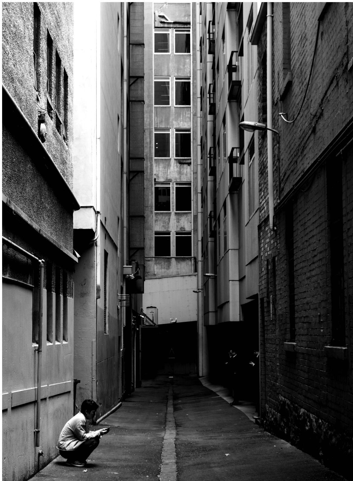
Fotografia: Steffi Pereira, 2019.