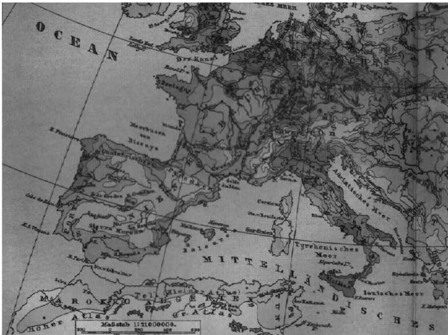
Figura 1. Densidad de población en Europa hacia 1900.