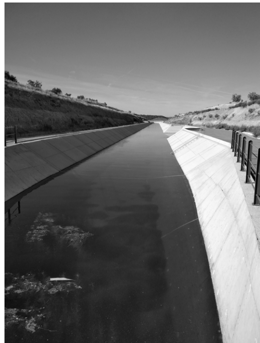
Imagen 2: Canal Segarra-Garrigues cerca del pueblo Maldà, Cataluña, 2019.

Las condiciones de vida de los agricultores no solo se ven afectadas en términos materiales, sino también de forma más simbólica. Un efecto secundario negativo de la expansión de la agroindustria es el sentimiento de decepción, inferioridad y falta de autoeficacia que desarrollan ante el crecimiento de las explotaciones vecinas a gran escala. Su frustración está relacionada con la percepción de la falta de reconocimiento de su trabajo y de las contribuciones que hacen a la vida sociocultural de los pueblos y la economía local.