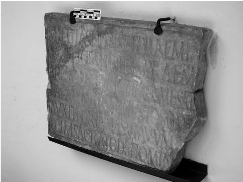
Al 1, 2