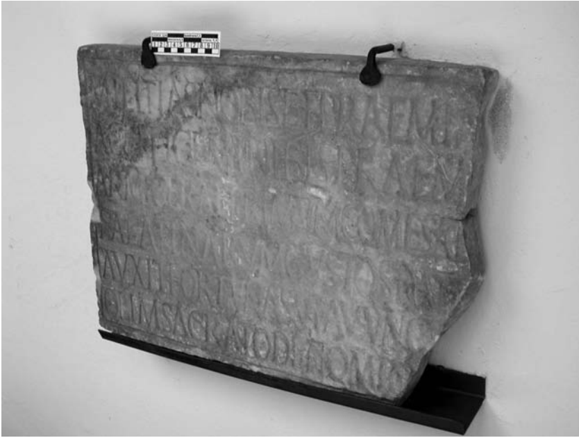
Al 1, 1