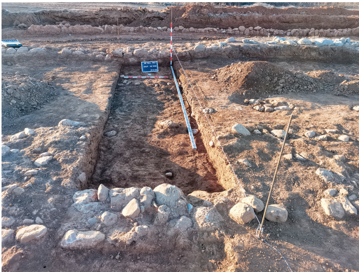
Figura 9. Treballs d'excavació en març de 2022 al sondeig del camí que segueix cap al sud-oest, vist des del nord; al fons es distingeix el marge UE 4003.

En aquest tram també s'ha començat a fer un sondeig de 6,50 x 1,50 m (Fig. 9), i malgrat que només comptem amb dades provisionals 1 , a diferència del camí septentrional, la part central de la calçada presenta un estrat de terra prou ennegrida, possiblement per la descomposició d'elements orgànics, amb abundant presència de pedres i fragments ceràmics, entre els quals hi ha d'ibèrics i un elevat nombre d'àmfores itàliques i púniques dels mateixos tipus que els identificats al camí septentrional, fet que demostra que tots dos són coetanis. En conjunt, poden datar-se en el segle II aC, possiblement en la seua segona meitat, en el període d'auge de l'assentament.