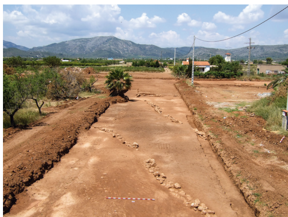
Figura 7. Fotografia del sector 8 amb el tram del camí que segueix cap al sud-oest excavat en 2007.

es va documentar un segon tram de 37 m longitud, una amplària de 5,45 a 7 m i els marges de traçat més irregular (Fig. 7).