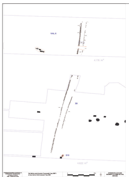
Figura 3. Planta del camí que segueix cap al nord, amb el tram del sector 9 excavat en 2007 i el tram del vial 6 excavat en 2021.

treballs agrícoles l'havien reduïda en algunes zones. Contràriament, en el marge est es van utilitzar pedres més grans, de fins a 50 cm, que es van col·locar a soles o de dos en dos, de vegades calçades amb altres més petites, amb una amplària total menor, de 40-60 cm. El fet que només es conserve una filera dels marges i que la franja intermèdia era de terra argilosa, fa suposar que la part superior del camí –amb la capa de rodolament– ha desaparegut.