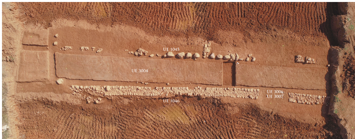
Figura 6. Fotografia aèria del tram excavat en 2021, amb indicació de les unitats estratigràfiques.