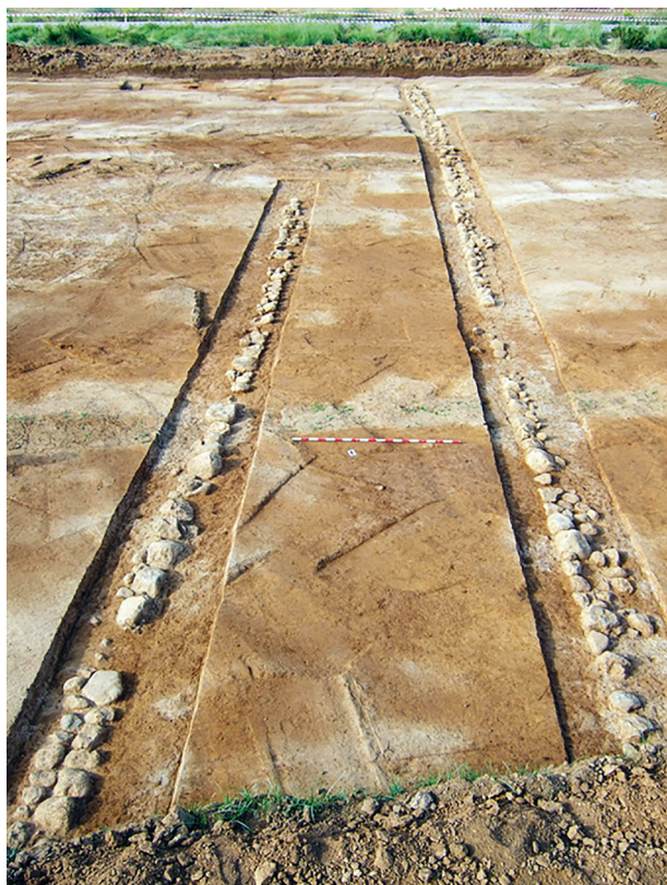
Figura 4. Vista cap al sud del tram de camí excavat l'any 2007.

desplaçaments de pedres com a conseqüència dels treballs agrícoles desenvolupats en la parcel·la (UE 3005); d'una altra banda, una rasa (UE 3006) feta per a enterrar una línia elèctrica ha arrasat les dues estructures i la calçada. Tot i que els dos marges presentaven fortes alteracions, s'ha pogut veure que les seues característiques eren semblants a les del primer tram, amb una major amplària del situat a l'oest. En conjunt, els dos trams tenen una longitud aproximada de 100 m, amb una zona intermèdia d'uns 15 m pendents d'excavació, i l'amplària de la calçada varia entre 2,40 i 4,50 m.