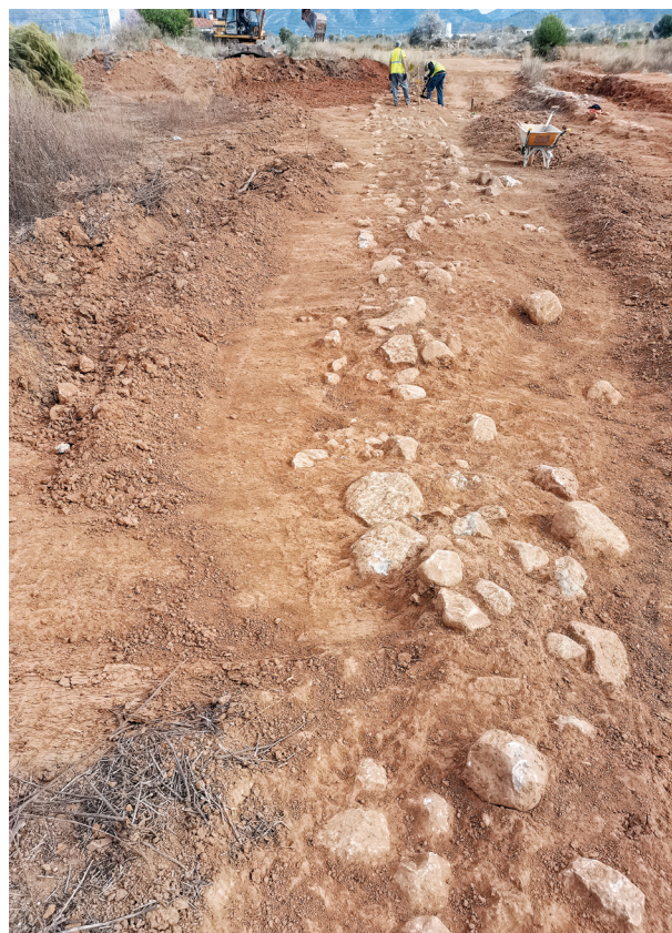
Figura 8. Treballs de neteja i excavació del tram del camí que segueix cap al sud-oest en març de 2022.

la parcel·la i una gran quantitat de pedres desplaçades, fet que en molts punts dificulta descobrir les dues cares del mur per establir-ne l'amplària (Fig. 8).