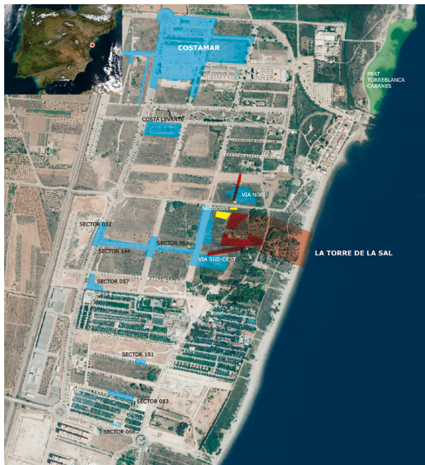
Figura 1. Localització del jaciment de la Torre de la Sal i la seua relació amb la resta de sectors intervinguts des de 2006.

País Valencià. D'altra banda, els nombrosos materials amfòrics recuperats en la zona marítima pròxima, proven l'existència d'un lloc d'ancoratge actiu almenys en els segles II-I aC.