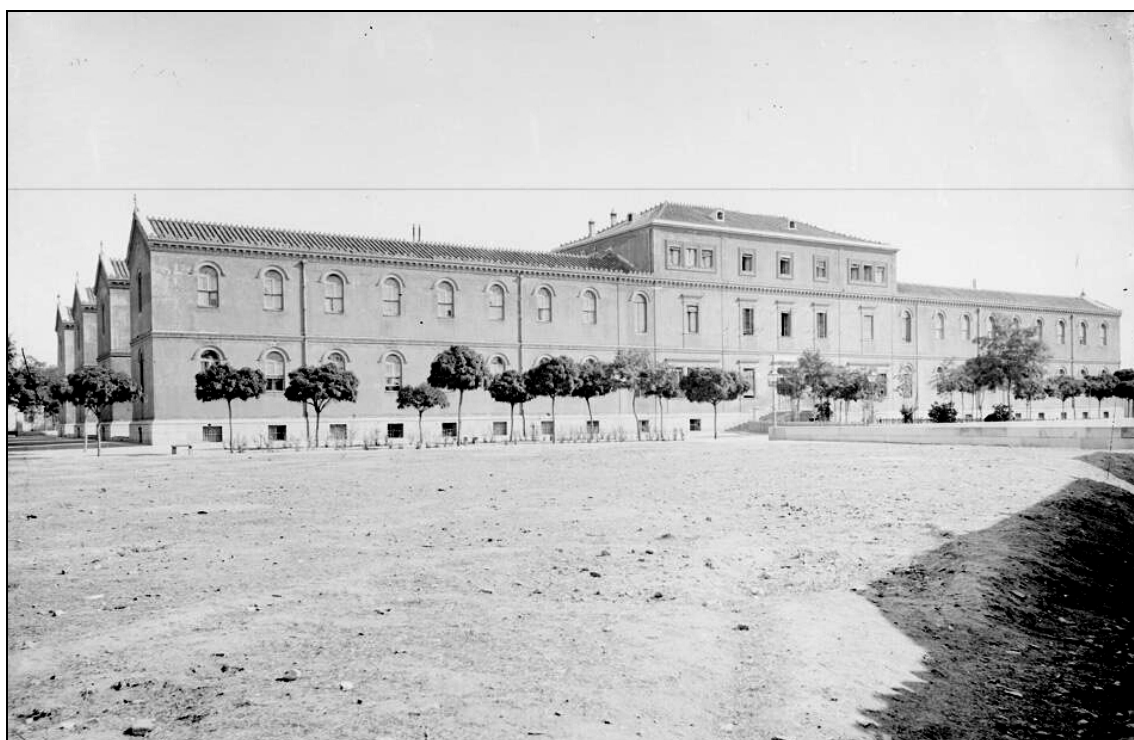
Hospital de la Princesa.

La primera piedra del hospital de la Princesa se colocó el día 16 de octubre de 1852, inaugurándose el día 24 de abril de 1857.