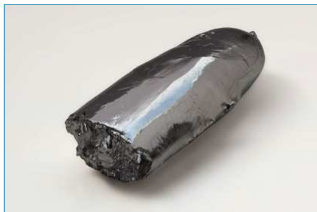
Figura 1. Barra de rutenio de alta pureza (99,99 %) obtenido mediante un procedimiento de fusión con haz de electrones [4]

aplicación más destacada en química es como catalizador de diversas reacciones de síntesis orgánica, estudios que han sido reconocidos con dos premios Nobel en este siglo. Probablemente la más relevante de ellas sea la metátesis de olefinas, una de las reacciones que más impacto ha tenido en la síntesis orgánica en los últimos años. Aunque ya era conocida en los años 60 del siglo pasado, recibió un impulso decisivo para su aplicación industrial con la introducción de los catalizadores homogéneos de rutenio de composición bien definida y estables al agua y al aire desarrollados por Robert H. Grubbs, [5] a quien se concedió junto a Yves Chavin y Richard Schrock el premio Nobel de Química en 2005 por el desarrollo del método de metátesis en síntesis orgánica. El otro premio Nobel (compartido) es el otorgado a Ryoji Noyori en 2001 por sus trabajos sobre hidrogenaciones enantioselectivas con catalizadores quirales de Ru. También se ha explorado como catalizador del proceso Fischer-Tropsch para la síntesis de hidrocarburos a partir de H 2 y CO, en la que presenta ventajas frente a los catalizadores de Co y Fe. Algunos de sus compuestos se están estudiando por su actividad antitumoral, en la que tiene beneficios respecto al cisplatino, y por sus propiedades fotoquímicas.