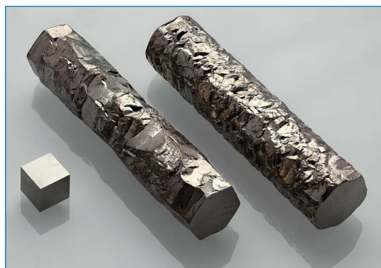
Figura 1. Barras de circonio puro del 99,97 % ( crystal-bar ) mostrando diferentes texturas y obtenidas por el método Arkel-de Boer (descomposición de yoduro) y un cubo de 1 cm 3 de circonio de 99,95 % de pureza [4]

El circonio es un metal gris plateado, duro y resistente a la corrosión por álcalis, ácidos, agua salada y otros agentes (Figura 1). [4] Se disuelve en ácido fluorhídrico al formar