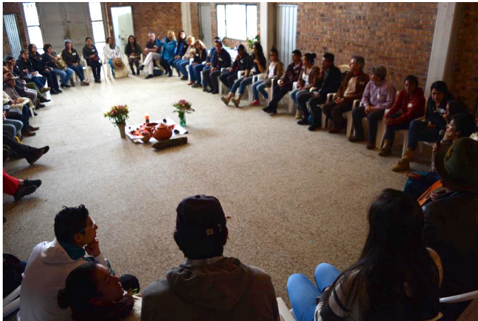
Figura 2. Círculos del agua