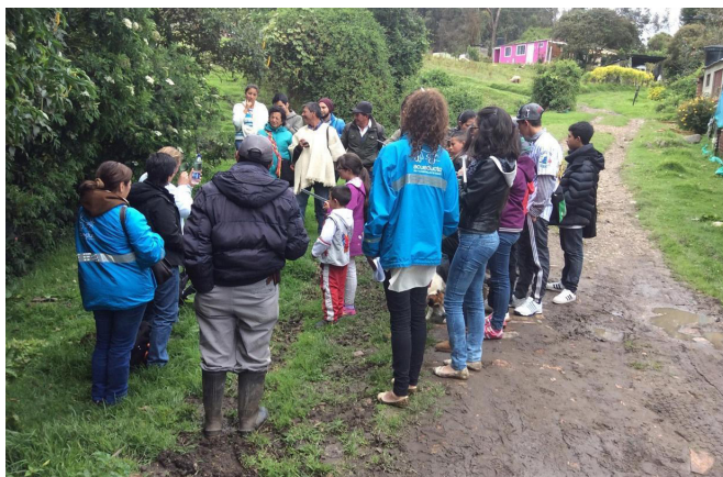
Figura 4. Monitores del agua