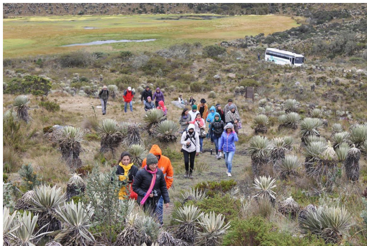
Figura 1. Caminatas rituales