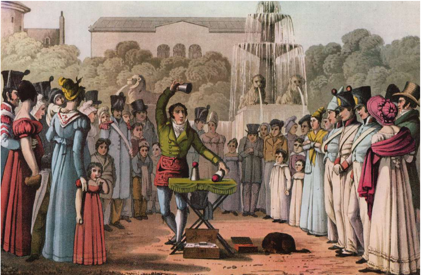
Imagen 1. The juggler at the Chateau d'Eau , (1822). Ilustración de una escena callejera donde se muestra a un prestidigitador realizando el clásico juego de los cubiletes.