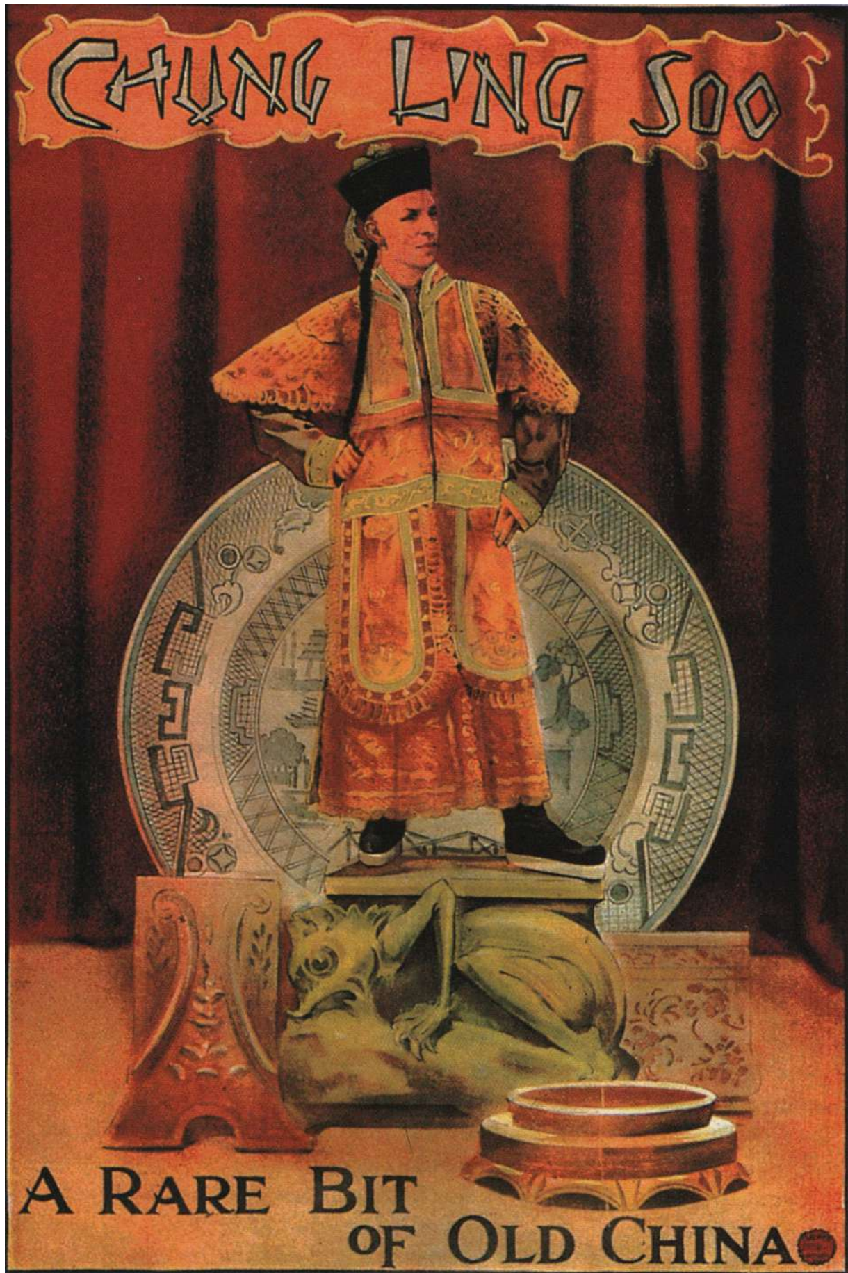
Imagen 3. Afiche promocional de Chung Ling Soo (1861-1918), nombre artístico del mago inglés William Ellsworth Robinson que adoptó la identidad oriental.