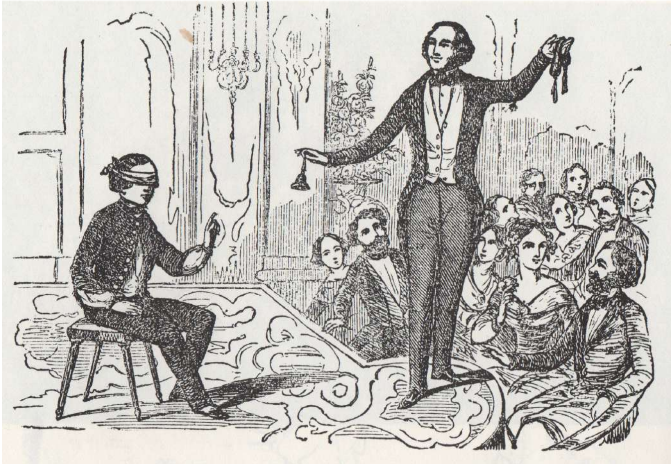
Imagen 2. Jean Eugène Robert-Houdin (1805-1871) presentando la Lectura a Ciegos frente al público parisino.