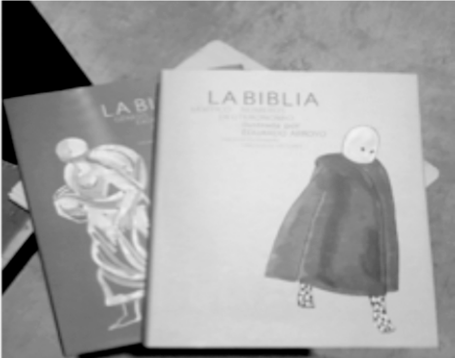
Figura 1: Portadas de la Biblia de E. Arroyo.

El artista, que no solo no se confesaba creyente, sino que se declaraba «ateo beligerante, no creyente e incluso crítico con la Iglesia como depositaria de los misterios» 25 , afirmaba su respeto y consideración por el valor literario del libro: «estamos hablando de un texto que encierra todo un universo de historias, relatos, metáforas, que lo hacen grandísimo, literariamente hablando» 26 ; «una literatura magnífica, llena de poesía y de gran modernidad». Pero, además, apun-