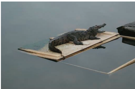
Foto 3. Habitat del Cocodrilo Moreletti en la Laguna del Carpintero. Tampico (México)