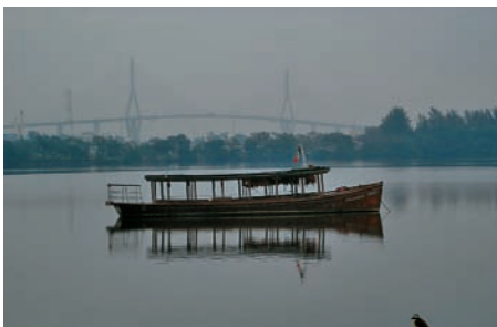
Foto 5. Paseos en barca por la Laguna del Carpintero. Tampico, TAM (México)