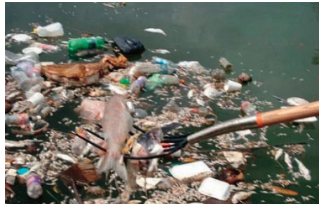
Foto 2. Aparecen centenares de peces muertos en la Laguna del Carpintero

Fuente: Diario Hoy Tamaulipas, 27/06/2007