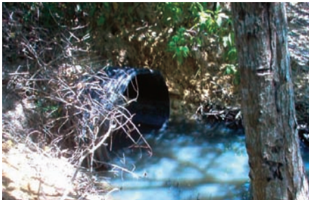
Foto 1. Descargas directas de aguas residuales Campañas Ciudadanas de Limpieza de a la Laguna del Carpintero (México)