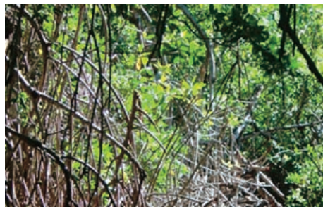
Foto 4. Manglar de la Laguna del Carpintero. Tampico, TAM (México)