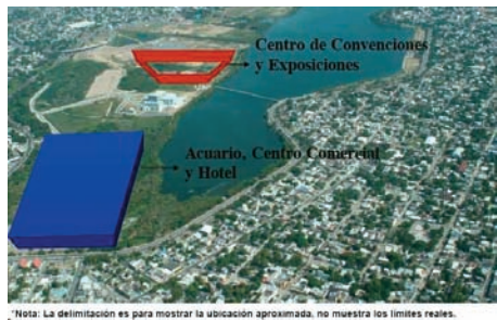
Foto 6. Área afectada por el Megaproyecto del Carpintero. Tampico, TAM (México)