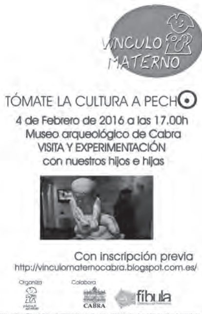
Lám. 10. Cartel de la actividad de la asociación Lactancia Materna de Cabra "Vínculo Materno".

Esta misma empresa se hizo cargo de otra actividad promovida por la asociación Lactancia Materna de Cabra "Vínculo Materno". El día 6 de febrero se realizó una visita tematizada el museo, centrada en la Época Ibérica, con un taller artesanal de elaboración de un sello siguiendo los modelos decorativos de las piezas expuestas. Como es habitual en esta