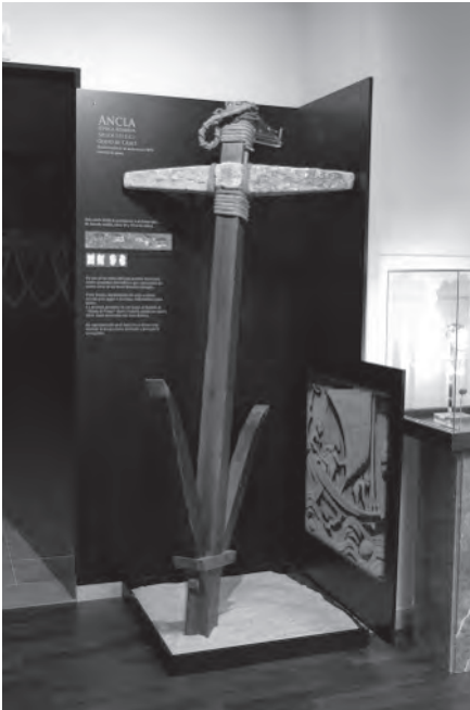
Lám. 1. Reconstrucción de ancla de Época Romana.

con la Iatvs de Venus, como símbolo de buena suerte. Esta nueva pieza se expone al inicio del espacio dedicado a Roma.