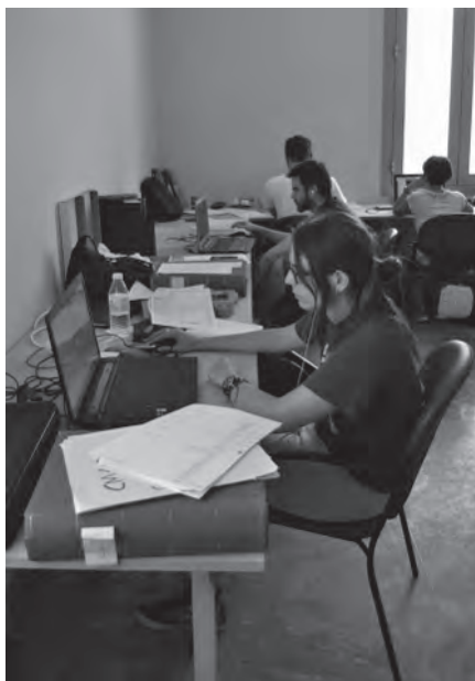
Lám 4. Parte del equipo de investigación del yacimiento del Cerro de la Merced en labores de estudio de materiales arqueológicos.

Durante todo el mes de julio se llevó a cabo la 5ª Campaña en el cerro de la Merced, pero a diferencia de los años anteriores, en esta ocasión no hubo trabajo de campo dedicándose fundamentalmente al estudio y análisis de los materiales arqueológicos. El trabajo estuvo