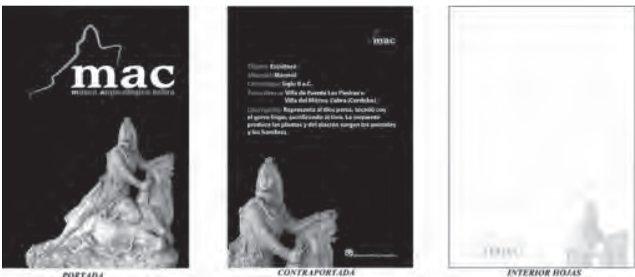
Lám. 2. Tienda del Museo: Libreta dedicada al dios Mitra.

Otra novedad ha sido la instalación, junto a la puerta de la conserjería, de una vitrina de pared donde se exponen diversos objetos para su venta al público. En esta pequeña “tienda del museo” hay libretas, imanes, marcapáginas decorados con motivos relacionados con las piezas arqueológicas más representativas del museo como la escultura de Mitra o el triente de Witiza y Egica acuñado en Egabro. Estos objetos han sido diseñados y fabricados por la empresa Notum Creaciones. También