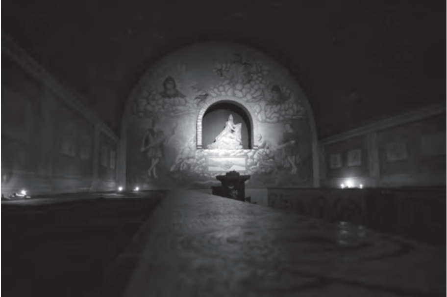
Lám. 7. Panorámica de la reconstrucción del mitreo.

da Guerra Mundial, se identificó en la zona de Walbrook un mitreo que fue excavado completamente. Fue desmontado por motivo de las obras previstas para esa zona y reubicado en un solar que no se correspondía con su original. En el año 2005 la empresa Bloomberg recibió la autorización para construir su sede en parte de ese solar y uno de los compromisos que el ayuntamiento de Londres les impuso fue tratar de respetar la presencia de los restos arqueológicos y en lo posible volver a poner en valor dicho yacimiento. Para eso se ha insertado en el proyecto arquitectónico un apartado para resituar el mitreo en su emplazamiento original, junto con un proyecto de difusión de los contenidos vinculados con este yacimiento. Como parte de este proyecto, desde el Museo de Londres se ha constituido un equipo de trabajo para discutir diferentes propuestas