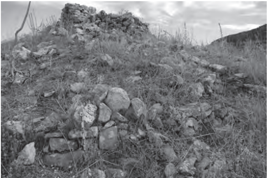
Lám. 6. La Almohalla. Fortificación de Época Emiral.

Como en el caso anterior el intento de situar el topónimo “Atalaya de la Zorra”, que aparece en una descripción relacionada con la minería de comienzos del siglo XX, condujo a la visita a una cumbre secundaria en la