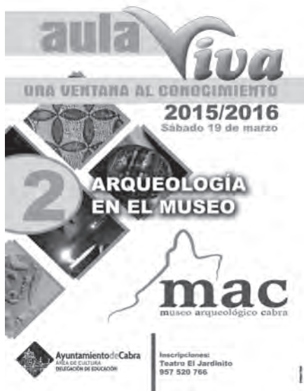
Lám. 11. Cartel de Aula Viva.

Según aparece en el Reglamento Municipal de la Mesa de Turismo del Municipio de Cabra, aprobado de forma plenaria el día de 20 de junio de 2016, el director del Museo Arqueológico Municipal formará parte de este órgano colegiado consultivo. De esta forma, durante el año 2016