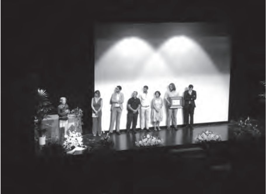
Lám. 5. Acto de entrega de la Mención Especial de los premios Egabrenses del Año 2016 al equipo de investigación de la necrópolis de La Beleña.