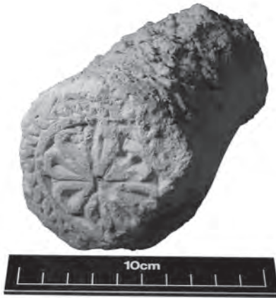
Lám. 3. Sello de alfar procedente del Barrio de La Villa. Antigüedad Tardía.

(posible Alfonso VII); 6 monedas de Época Moderna; 6 monedas de Época Moderna reselladas; 3 monedas de Época Contemporánea (Isabel II, Fernando VII); 10 monedas de Época Contemporánea (Gobierno Provisional); 9 monedas de Francia (Luis XVI, Napoleón III, República, etc.); 4 monedas de Época Contemporánea (Portugal, R.U., Alemania, España); 15 monedas en muy mal estado de conservación. Otras piezas: ficha de trabajo (A.M.); busto monetiforme recortado; medalla de carácter religioso. Lugar del hallazgo: Desconocido.