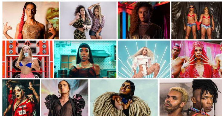
Imagem 2. Mosaico com algumas artistas da cena