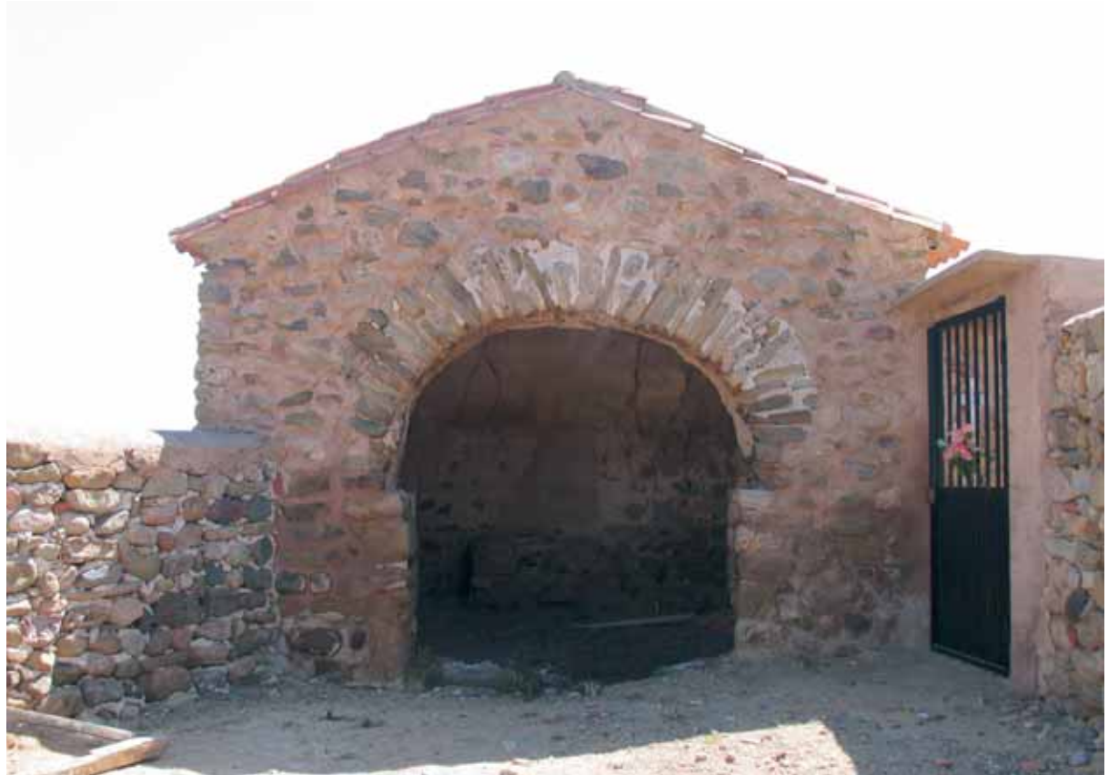
Cabecera con arco triunfal vista desde lo que fue la nave de la ermita