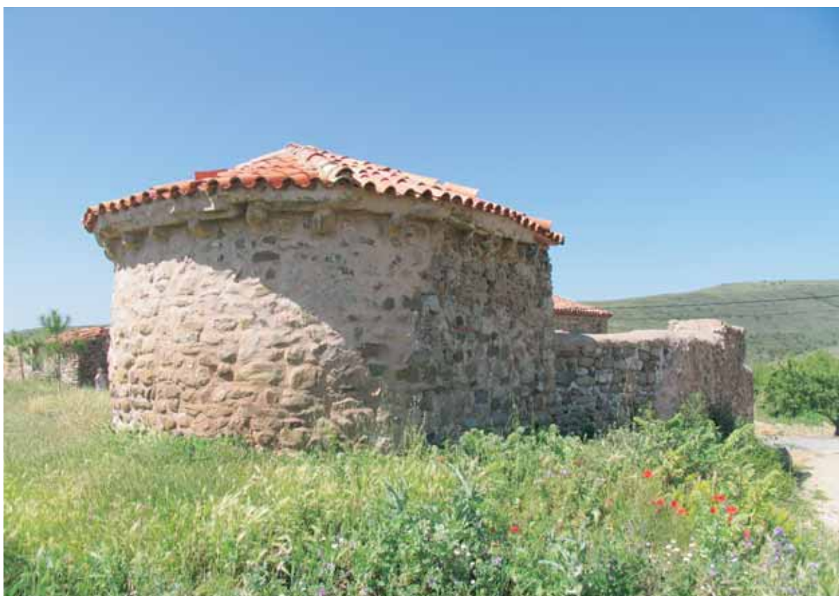
Exterior de los restos de la ermita