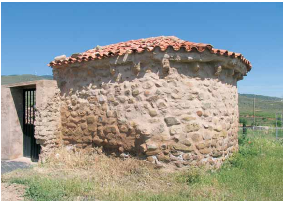
Vista del ábside desde el Sudeste