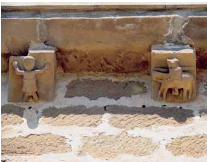
Canecillos del muro sur de la nave

capilla septentrional con piedra artificial; se limpió el resto de la fachada norte, pues la hiedra que la invadía estaba produciendo graves daños en la fábrica; se arreglaron grietas de la fachada sur; y se restauró el interior mejorando el tratamiento de las paredes, limpiando el coro bajo y acondicionando la entrada al husillo de la espadaña.