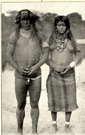
Abb. 4. Chipaya-Ehepaar. (Der Mann war im Gesicht bemalt; seine Körperhöhe betrug 161 \frac{3}{4} cm.)

Só vi cocares em dois homens, e mesmo eles os colocavam somente de vez em quando. Um velho Xipaya usava pelas manhãs, às vezes, um cocar de penas amarelas de arara. Essas ficavam viradas para abaixo, de modo que dava a impressão de ser uma aba larga de chapéu, sem a parte da cabeça (cf. Ilustr. 4). Um outro índio ainda bem jovem, também Xipaya, usava uma longa pena de cauda de arara, que perfurava a orelha.