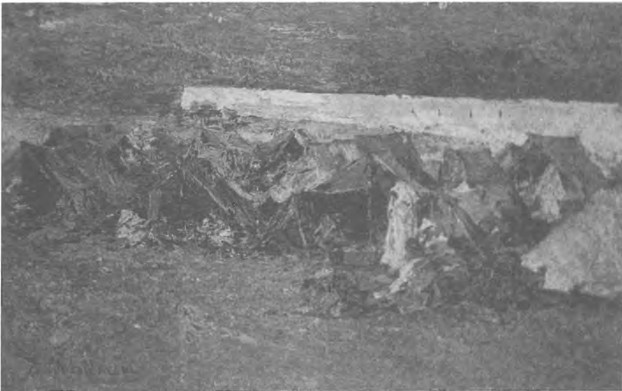
4. Benlliure, J.: Zapateros juntos en Marruecos . Oleo sobre tabla (13x20). Colección particular.