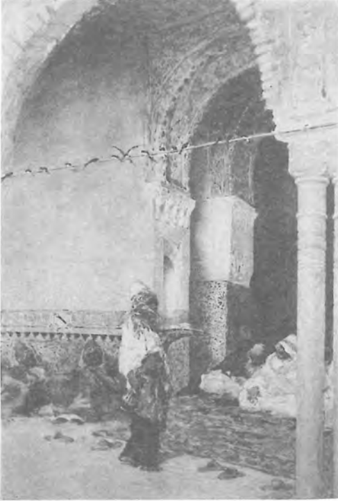
3. Fortuny, M.: El café de las Golondrinas (1868). Acuarela (49x39). Walters art Gallery. Baltimore (E.E.U.U.).