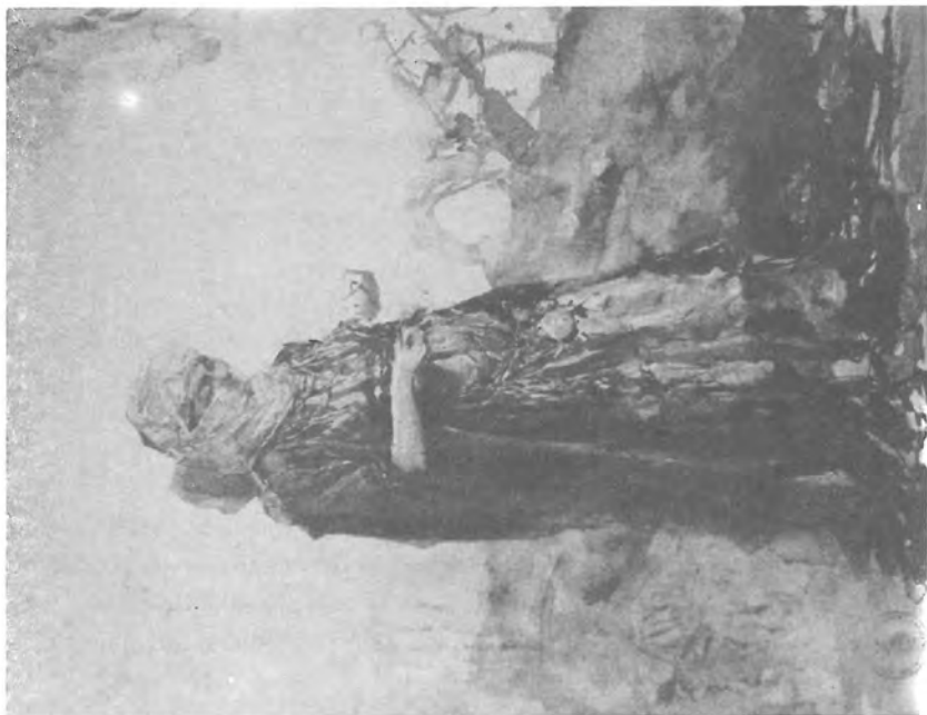
1. Benlliure, J.: Mora (40x31,5 cms) Acuarela Casa-museo de Benlliure. Valencia.