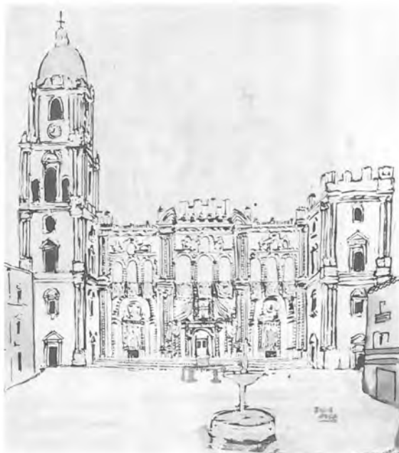
Figura 4: Plaza del Obispo (Dibujo de Fernando de la Rosa).