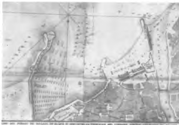
Figura 3: Naumaquia. Grabado de la que se realizó en la proclamación de Carlos IV en 1789.