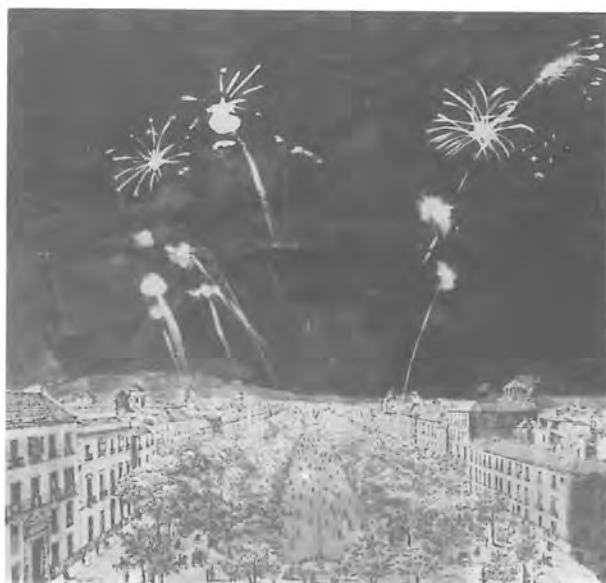
Figura 5: Fuegos artificiales en la Alameda (Dibujo de Fernando de la Rosa sobre un grabado del siglo XIX).