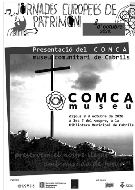
FIGURA 1. Cartel de presentación de la entidad. IMAGEN: Esther Lupresti.

ción tendría que cubrir estas necesidades igual que cubre otras. Todos necesitamos un espacio donde recuperar nuestra memoria. La misión del Museo Comunitario de Cabrils es la de: