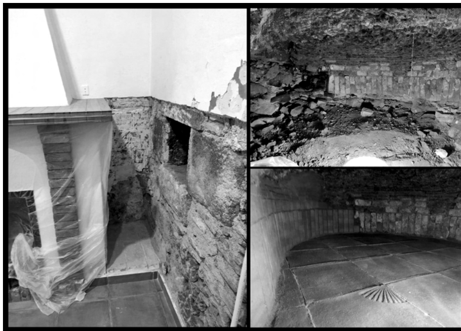
FIGURA 4. Horno tradicional de pan en una casa de Cabriils. El COMCA realizo labores de asesoramiento para la recuperación de este elemento.

cultural de Cabriils, en una situación muy grave y de desamparo, que necesitaba revertirse. (FIGURA 4)