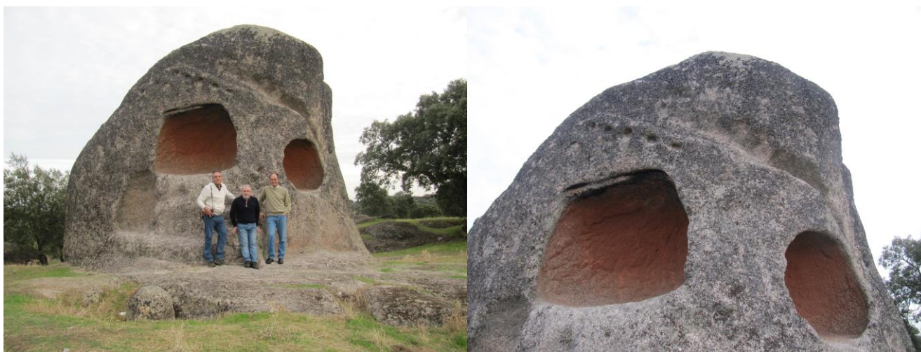
Bloque y detalle

otra regata horizontal, aunque aquí no hay oquedades.