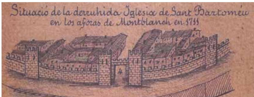
4. Portal de Sant Francesc, i part de la Vila de Montblanc (figurada).

Sí, la comissió territorial de patrimoni ens ha obligat a que hi hagi una evidència clara que, d'una simple mirada, es vegi que no es original.