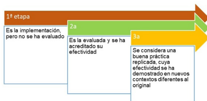
Figure 1. ILO adaptation (2015)

El interés de apoyar al docente llevó incluso algunas de estas empresas a crear sus propios institutos, a fin de acompañar al docente en la creación de recursos didácticos en formato multimedia, como es el caso de Genially Academy, que ofrece cursos gratuitos a través de su página: https://bit.ly/AprendeConGeniallyAcademy