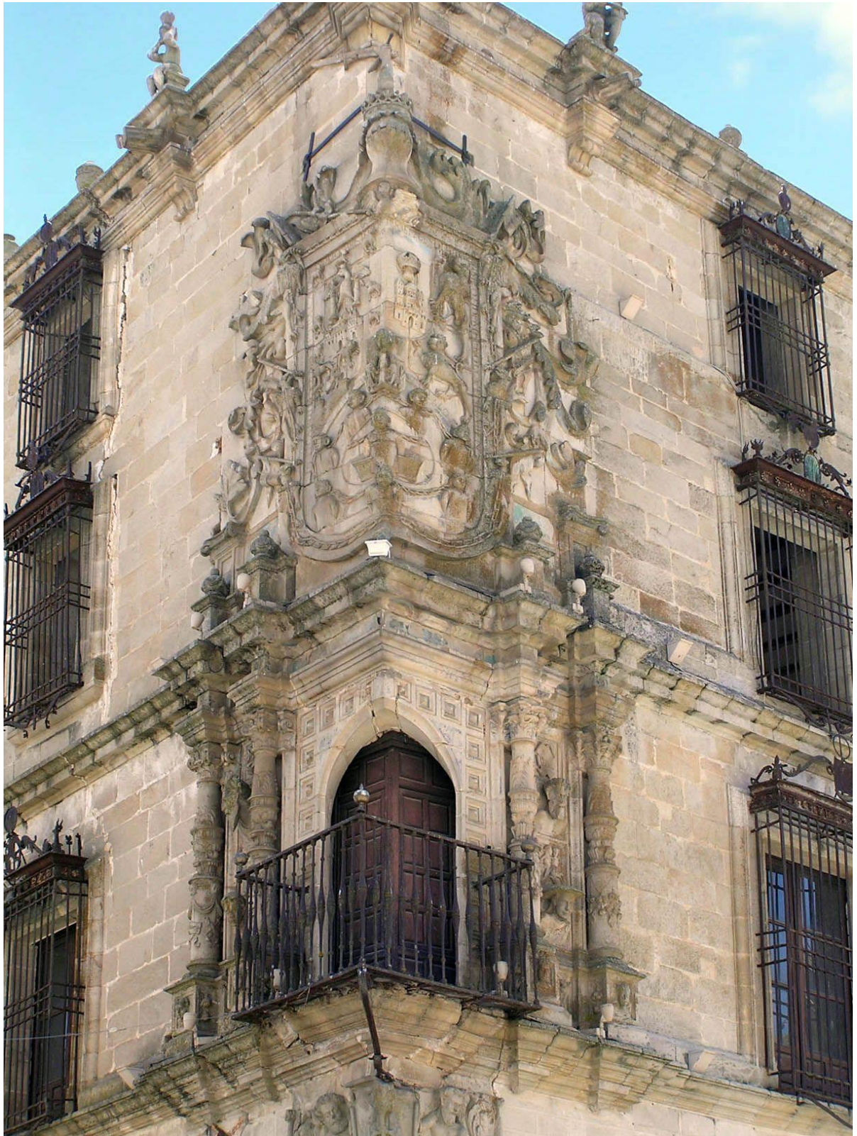
Balcón renacentista esquinado en el Palacio de La Conquista coronado por el escudo de la Casa