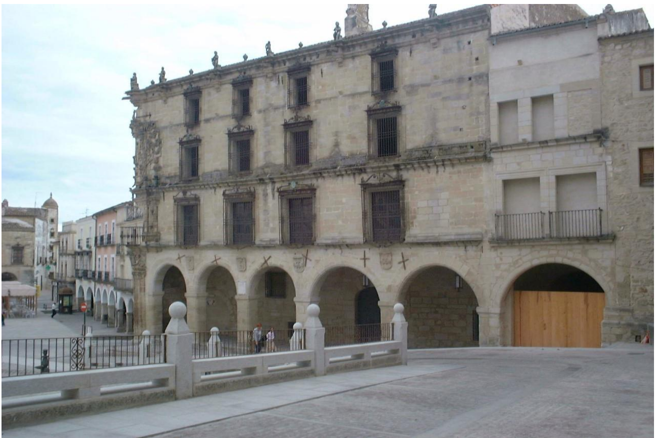
Palacio de La Conquista

A su llegada a Sevilla, según los datos recogidos en el viaje, se gastará 72 maravedíes en ropa y 17 maravedíes en joyas toledanas. Aparte de sus objetos personales, comprará una vajilla de plata para su servicio, candelabros y platos, saleros de plata, etc., gastándose dos mil ducados en oro, cifras elevadas que solo podía permitírsele una rica encomendera peruana.