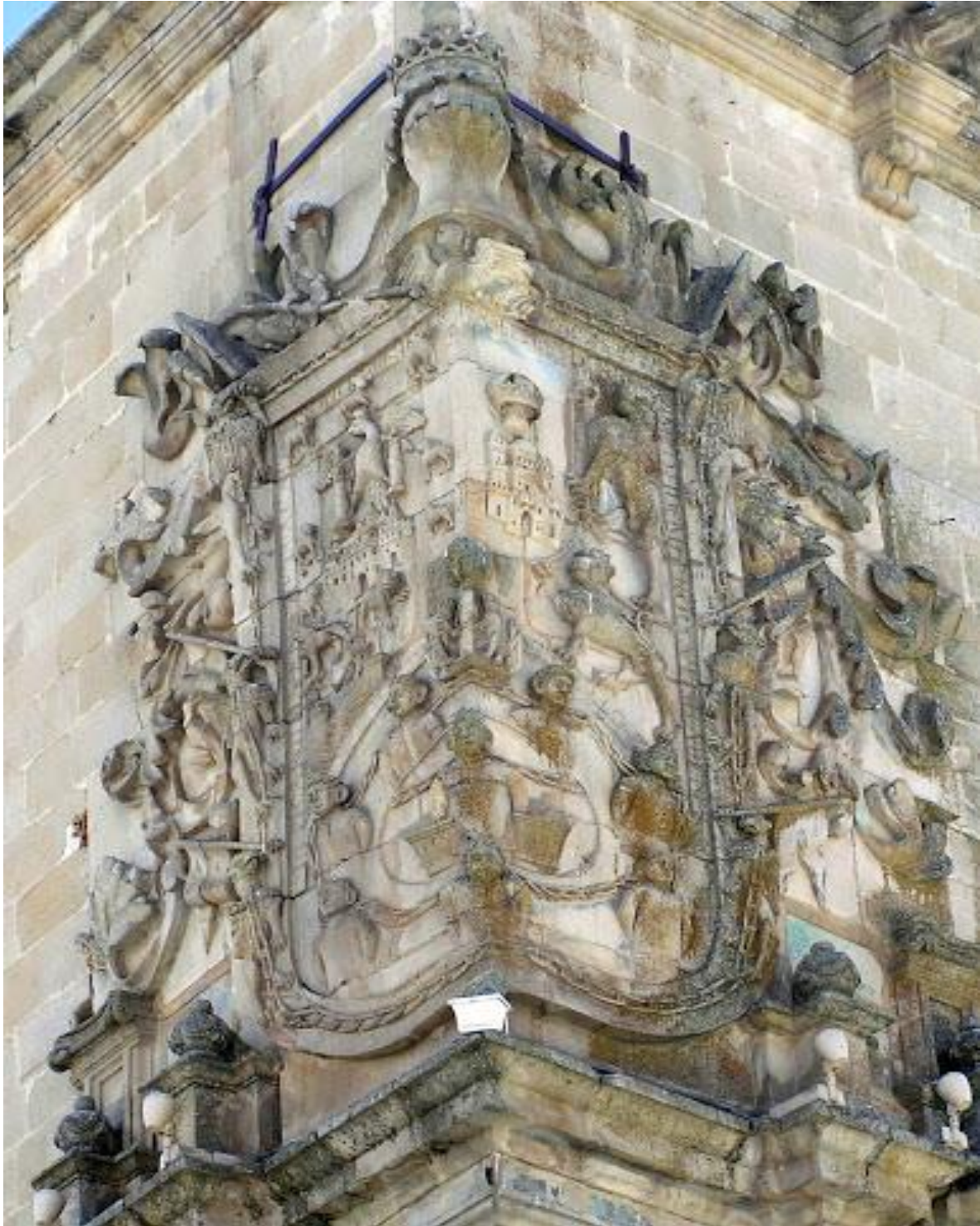
Detalle del escudo

Como ya hemos indicado, Francisca parte hacia España el 15 de marzo de 1551 (ya había sido la promotora de una construcción religiosa en Lima, la capilla en la que descansan los restos de su padre) y había dado en Panamá 38 pesos para la obra del convento de San Francisco y ordenará que