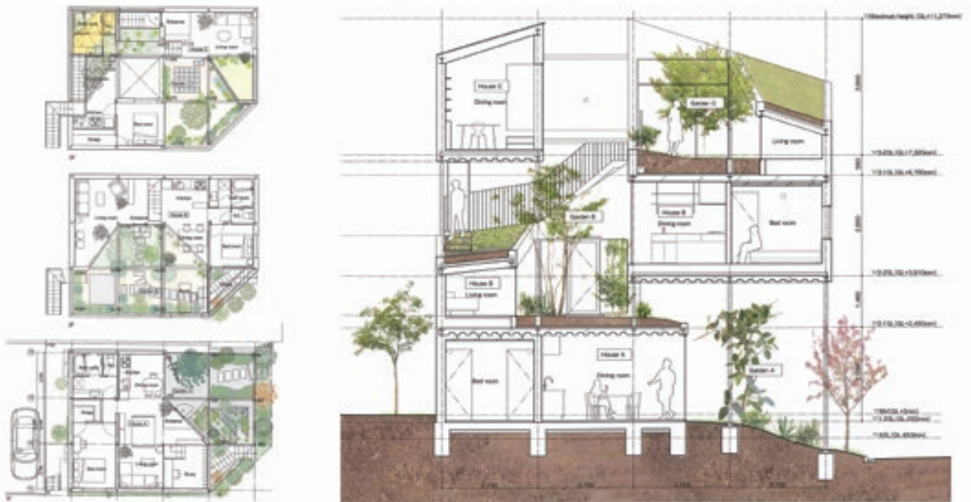
Figura 4. Akihisa Hirata. Casa Superpuesta . Plantas y sección.

Esta idea del edificio como soporte de un espacio ajardinado no es nueva en la arquitectura moderna o contemporánea, siendo el referente más claro la cubierta jardín propuesta por Le Corbusier en los años 20 del siglo pasado. 19 Sin embargo, en los proyectos que nos ocupan, la posición del jardín no se limita a la cubierta, sino que se entremezcla con los diversos espacios de las viviendas en cada una de sus plantas.