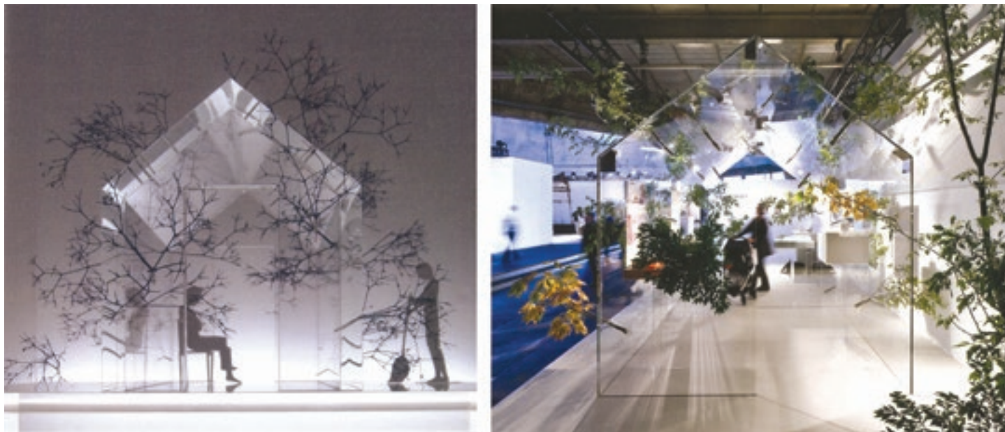
Figura 9. Sou Fujimoto. Casa/Árboles en Basilea. Maqueta y pabellón construido.