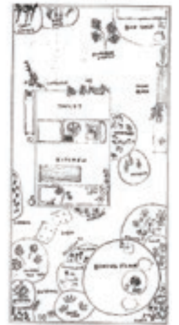
Figura 7. Junya Ishigami. Casa entre medianeras . Dibujo conceptual del espacio interior y plantas con estudios de ubicación de los diferentes elementos.