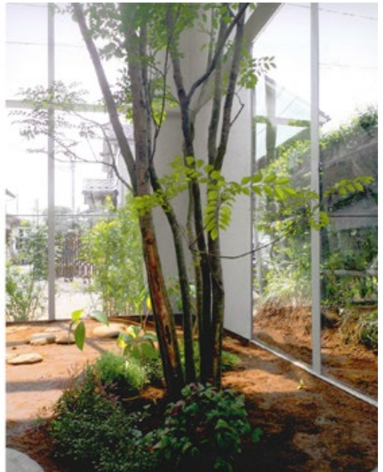
Figura 8. Junya Ishigami. Casa con plantas . Vistas interiores.