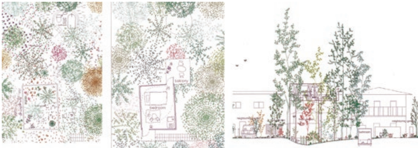
Figura 5. Junya Ishigami. Proyecto T . Planta baja, planta primera y sección.