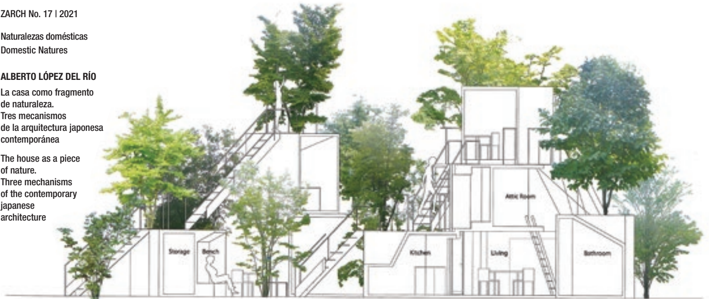
Figura 2. Sou Fujimoto. La Casa antes de la Casa en Utsunomiya. Sección.

The house as a piece of nature. Three mechanisms of the contemporary Japanese architecture