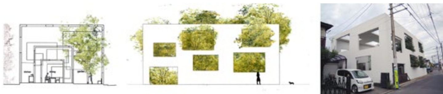
Figura 6. Sou Fujimoto. Casa N . Sección, alzado e imagen exterior.

Es el caso del proyecto Casa/Jardín (2008) en Tochigi, de Sou Fujimoto, en el que un primer muro exterior delimita un fragmento de un entorno natural, idea que desarrollará en la Casa N (2008), en Oita. Esta vivienda se compone de una serie de cajas, contenidas unas dentro de otras, que van definiendo los diferentes niveles de privacidad, a lo que Fujimoto se refiere como anidación telescópica 26 , incorporando la caja exterior a todas las demás y un pequeño jardín en el que se plantan varios árboles. Todas las cajas se perforan tanto en sus paramentos como en sus cubiertas, acristalándose únicamente los huecos de las cajas interiores, de tal manera que el viento, la lluvia, la vegetación, se filtran a través del último cerramiento (figura 6).