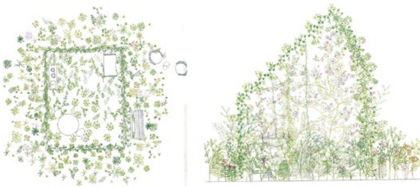
Figura 10. Junya Ishigami. Casa de plantas . Planta y sección.

Para ello, la arquitectura va cediendo progresivamente parte de su materia y su esencia en favor de la naturaleza. Los forjados y cubiertas sirven como soportes de la vegetación en todos los niveles, de tal manera que se reduce el espacio habitable exclusivamente interior y este se entremezcla con la vegetación. O este espacio queda incluido en un receptáculo, creándose un jardín habitado, una naturaleza humanizada en la que se ubican enseres y pequeñas construcciones como muestra de esta cualidad. Para, finalmente, fundirse la materialidad de lo natural y lo construido, quedando la arquitectura compuesta total o parcialmente por elementos vegetales, que la hacen temporal y perecedera. Es así que, progresivamente, se produce la pérdida de importancia del objeto arquitectónico, que se va borrando hasta casi desaparecer, en favor del acercamiento entre lo humano y lo natural.