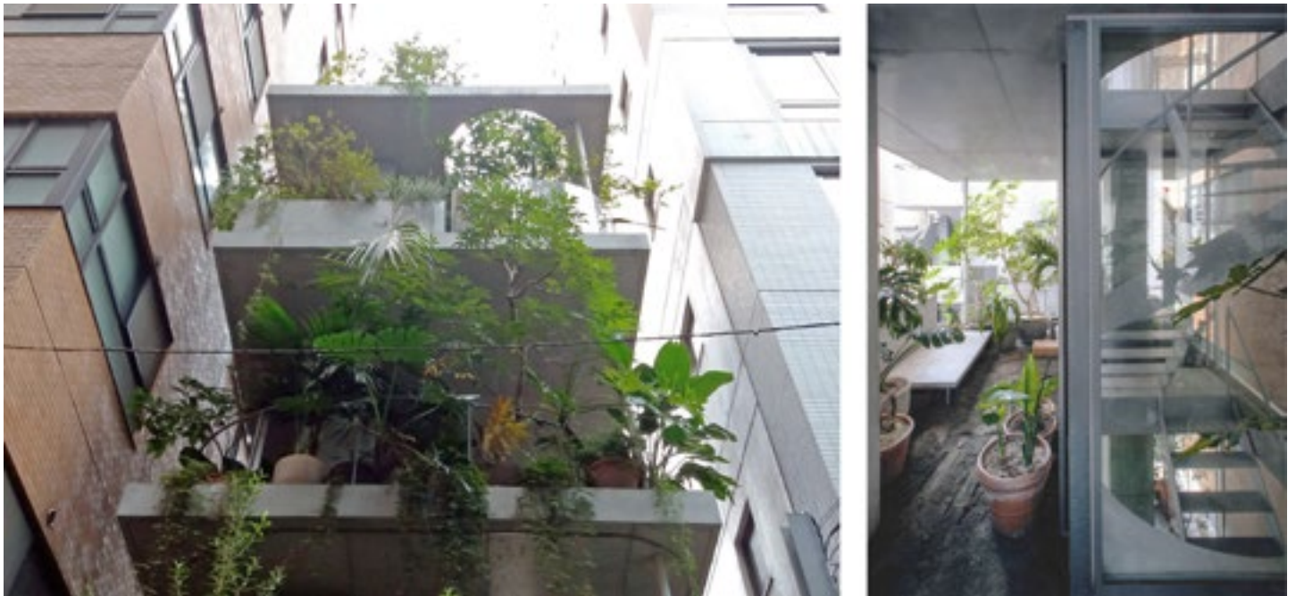
Figura 3. Ryue Nishizawa. Casa y Jardín . Imagen exterior donde se aprecian las jardineras de hormigón, las perforaciones de la estructura y las macetas, y vista interior de la segunda planta con el suelo de tierra