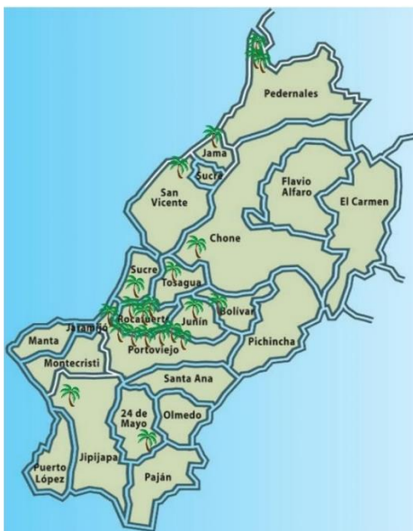
Figura 2. Sector cocotero de Manabí.

Productores D.2: Sus plantaciones se encuentran en la ciudadela 30 de Marzo, su cosecha es de alrededor de 500 cocos verdes al mes, los cuales los comercializa. Los residuos generados los traslada al botadero.