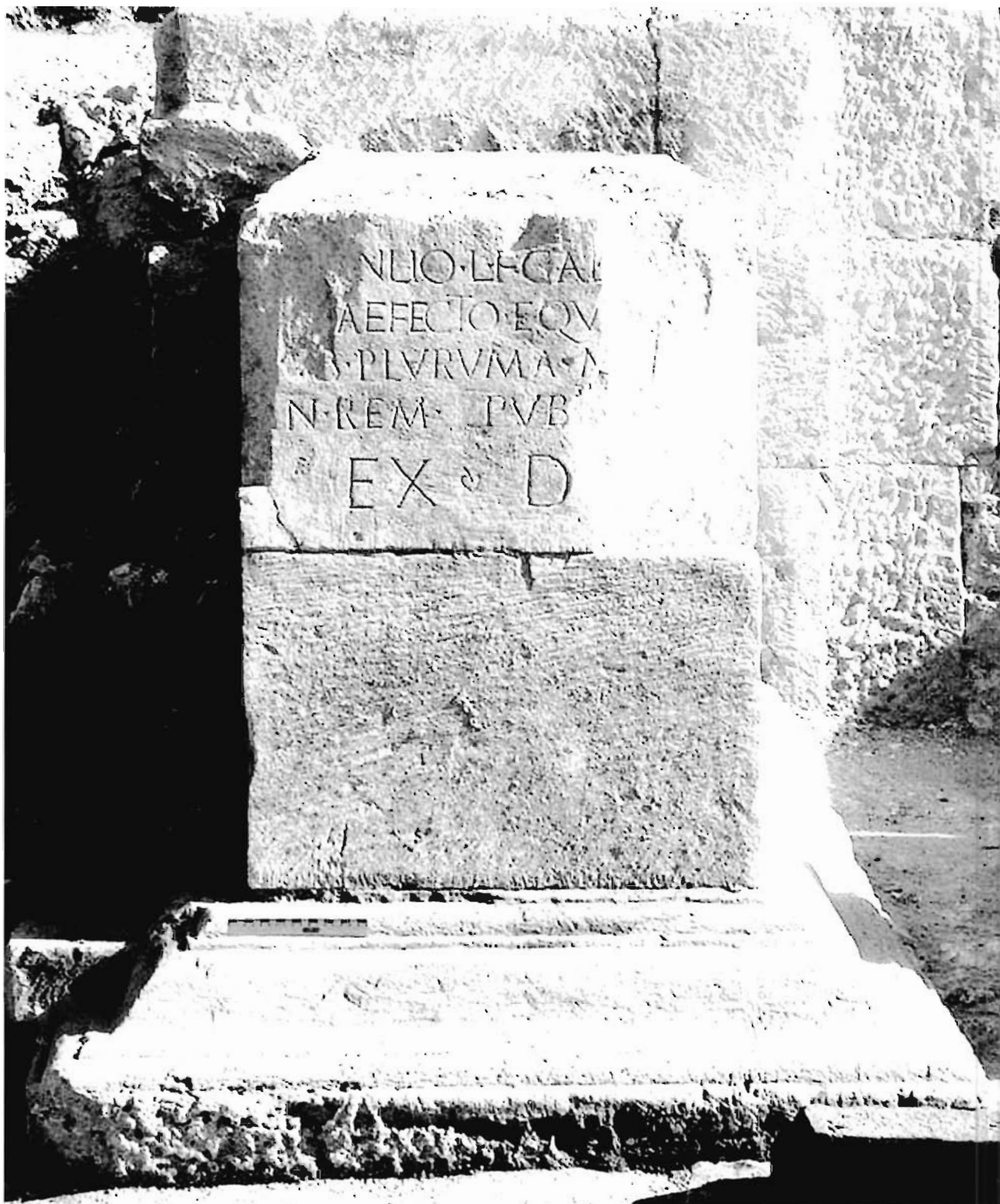
Lámina 2. Segobriga . Pedestal de la estatua de L. Manlius, tal como se ha conservado in situ .