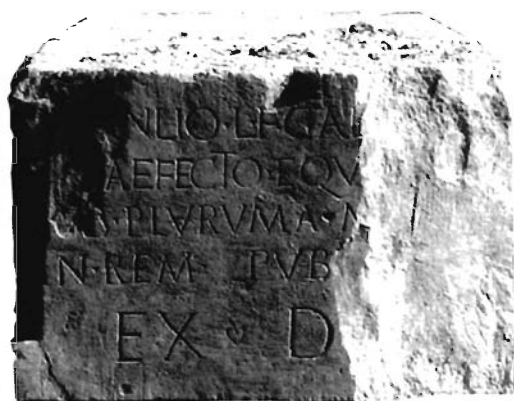
Lámina 1. Inscripción de L. Manlio, praefectus equitum de Segobriga (detalle).

Licencia del soldado y muerte del mismo no son fechas coincidentes. Sólo la última cronología coincide con el epitafio; y, si admitimos que G. Iulius disfrutara algún tiempo de su condición de retirado, y en paz, quizás sería aconsejable retrasar algunos años la datación del documento, hacia 70-75 d.C., unos años después de que el último soldado en servicio de esa legión (incógnita) abandonara la Península Ibérica.