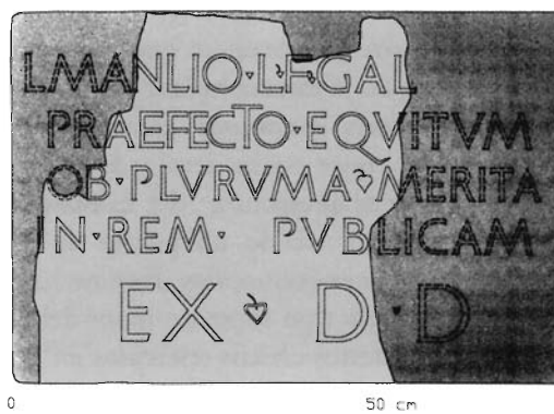
Figura 2. Reconstrucción de la inscripción de la lám. 1.

El texto que comento ahora muy brevemente ha sido presentado y estudiado en un trabajo colectivo que da noticia de nuevos e interesantes documentos epigráficos de Segobriga 22 . Se trata de un bloque piedra caliza local, del que ha perdido aproximadamente el 40% de la masa, pero que por sus dimensiones sirvió con toda probabilidad de base de una figura ecuestre situada a lado derecho de una escalera monumental, con peldaños de más de 2 metros de longitud, que conducía "hacia el piso superior del pórtico o hacia el exterior del foro". Se conserva in situ , tras su descubrimiento en agosto de 2002. Las dimensiones del bloque con inscripción son 50 x 78 x 93,5. Las cuatro primeras líneas de escritura presentan letras de 4,5 cm., y la última de 8 cm.