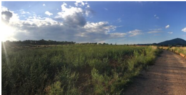
Imatge de Berta Tiana.

El 30 d'octubre de 2020 entrà en vigor a Catalunya una de les mesures més controvertides per frenar el contagi del coronavirus SARS-Cov-2, el confinament perimetral. La mesura, que restringia la mobilitat entre municipis —més endavant ho feu entre comarques—, ens obligà a restar en el propi municipi durant els caps de setmana i els dies festius. Per primera vegada, molts de nosaltres vam experimentar la sensació de ser presoners de la ciutat; vam viure les dificultats de sortir-ne, d'escapar-ne, especialment en aquells casos en què l'entorn construït ocupa gran part del terme municipal.