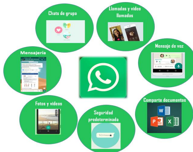
Figura 3. Funciones académicas de WhatsApp, basado Web Whatsapp.com (2021)

en su seguimiento y en el fijar horarios para las actividades académicas propuestas de acuerdo a la edad de los estudiantes (Malo-Cerrato, Martín-Perpina y Vinas, 2018). Es así que es muy importante direccionar el uso de WhatsApp para lograr desarrollar aprendizajes en un futuro, como parte no solo de una enseñanza netamente virtual sino también como complemento de la educación presencial análoga.