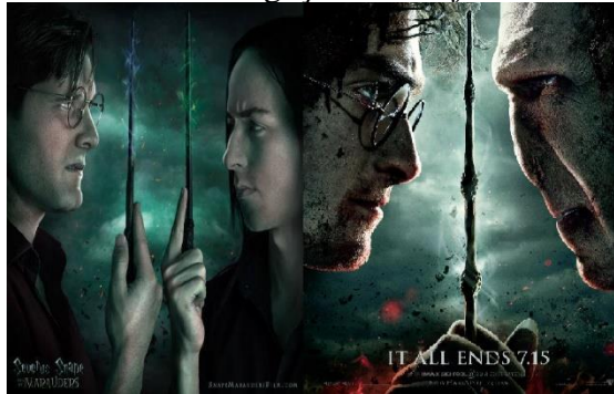
Figura 1 - Cartazes de divulgação do Fanfilm e de Harry Potter