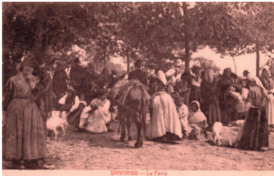
A feira na carballeira de Santa Susana (Postal, c. 1910. Colección «Sanxiao - Lodeiro»).

dúas carballeiras como só a de San Lourenzo, estaba claro que o conde llo doara á cidade para en todo tiempo de syempre la tenga para su serbidumbre e pasto comun e plantar de arboles e arboledas , e non aos franciscanos 18 .