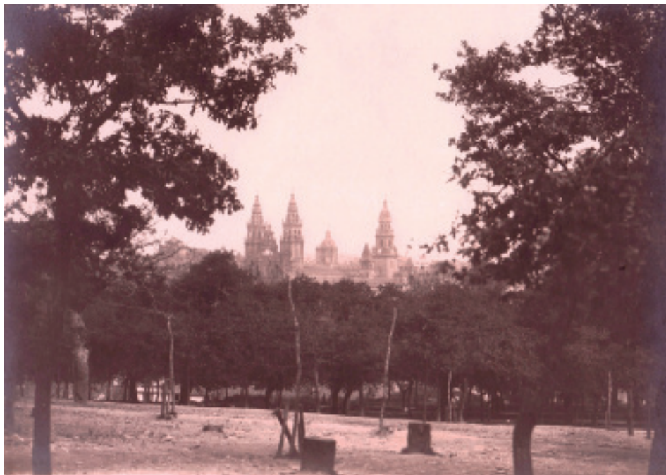
As torres da catedral dende a carballeira de Santa Susana (Fotografía de autor descoñecido, c. 1920. Colección «Sanxiao - Lodeiro»).

terreos. A cuestión non era doada de dilucidar, partindo de que o Comisario de Montes da provincia da Coruña nunha visita que fixo en 1848, afirma o seguinte da de Santa Susana: