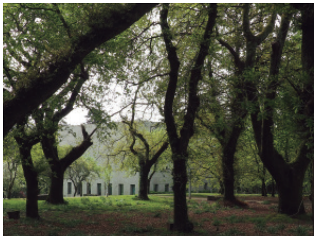
A carballeira de Vista Alegre e ao fondo o Centro de Estudos Avanzados da Universidade de Santiago.