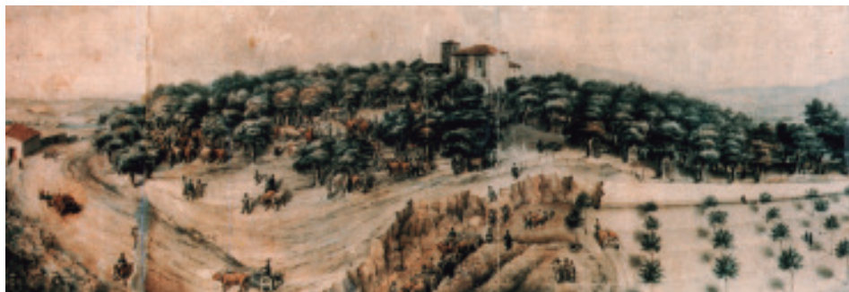
A carballeira de Santa Susana contra o ano 1837. (Pormenor da vista panorámica da cidade deseñada por Ramón Gil Rey, acuarela, Concello de Santiago de Compostela).

sitio onde se vendían ou criaban estes animais 4 . Non se sabe se daquela era terreo comunal ou había alguén con dereitos sobre el, nin se estaba raso ou poboado de árbores.