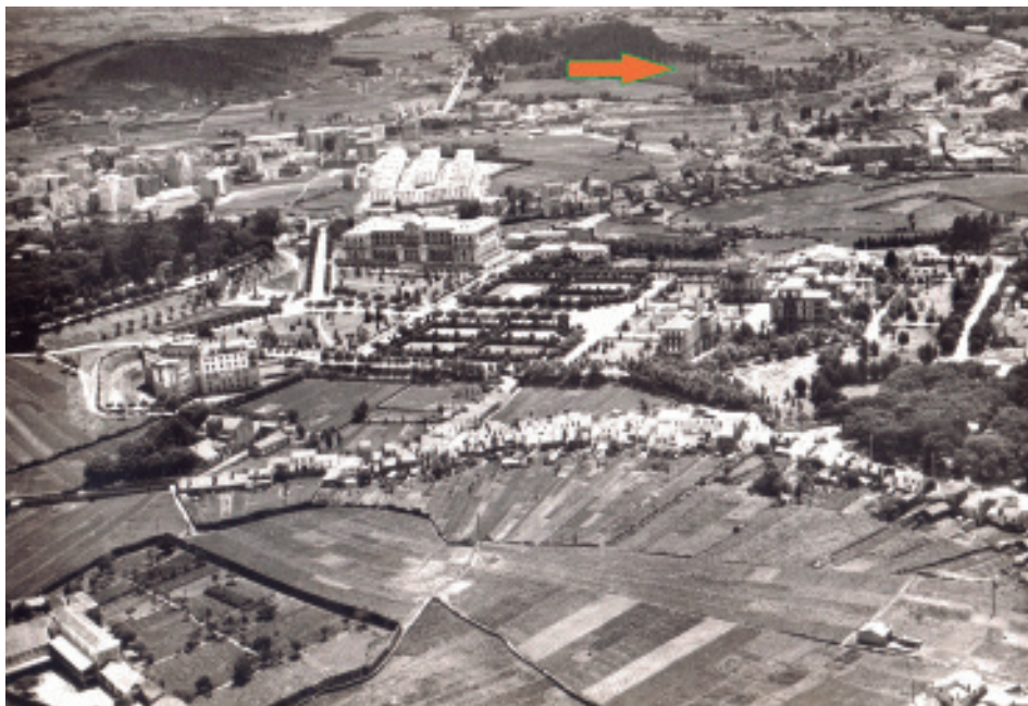
Vista xeral do Campus Sur coa carballeira de Santa Susana á esquerda e a de San Lourenzo á dereita. Ao fondo (senalada cunha frecha) a do Paxonal (actual parque «Eugenio Granell»). (Postal, c. 1960.).

facer unha casa, entre a primeira torre da Porta de Mazarelas (agora Mazarelos) e a segunda da esquerda, constando que era onde se achaba o carballo de Mazarelas . Neste caso non estaba dentro como o anterior, pero case a carón do muro. Non dei con máis datos e descoñezo como nin cando desapareceu 2 .