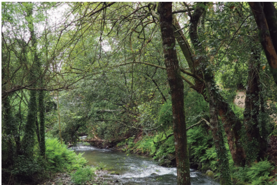
O Sar ao seu paso polo parque de Brandia, entre ameneiros, salgueiros, carballos...