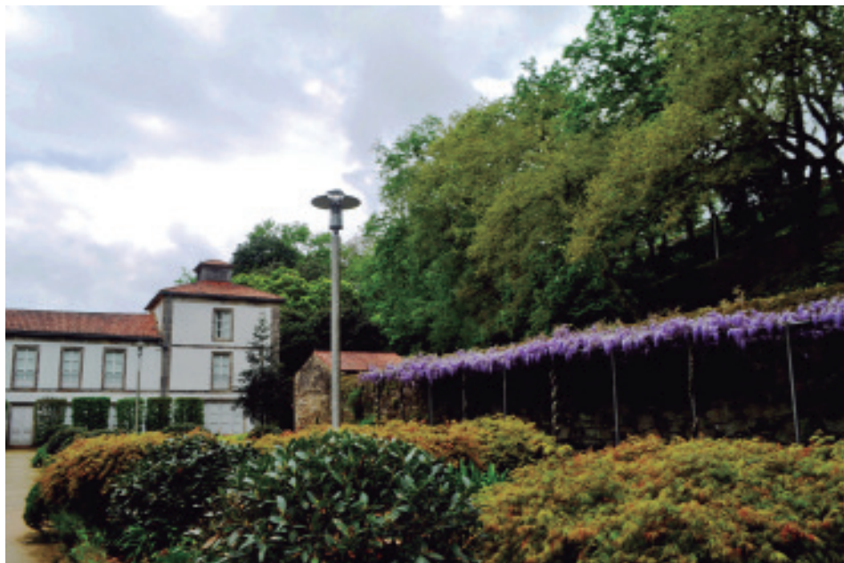
Vista parcial da carballeira de Brandia co xardín e a casa da antiga fábrica de curtidos (agora local sociocultural de Vidán).