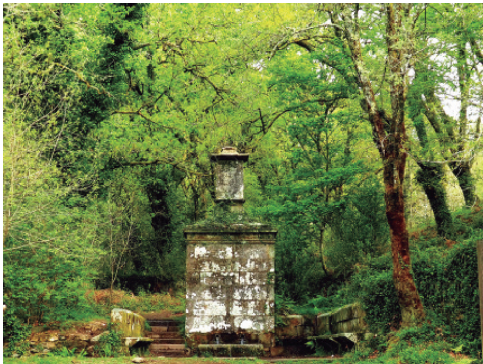
A monumental fonte da Selva Negra, entre carballos. Estaba coroadada por unha cruz.

A consideración de case pública procedía da época en que había preto da fonte unha ermida dedicada á Virxe do Carme. Non se sabe se a construíran os veciños ou o propietario, pero xa existía en 1662, que quedou abandonada ao facer outra máis abaixo na orella do río Sarela, xusto onde o cruza a ponte do Arcebispo, substituída pola actual igrexa entre 1760 e 1773.