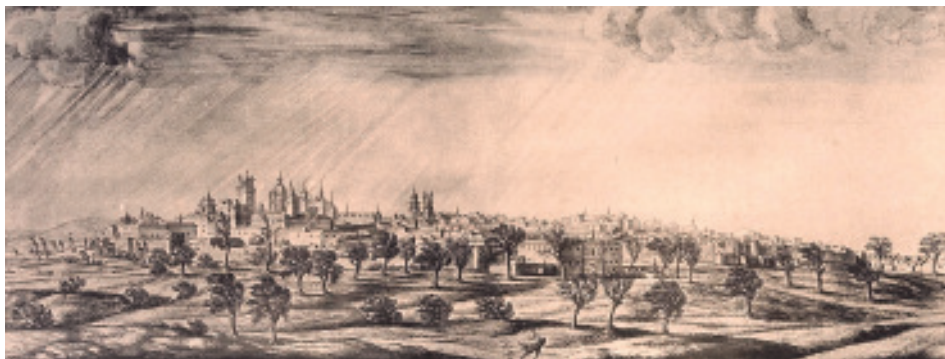
Vista xeral da cidade co edificio do colexio de San Clemente de Pasantes en primeiro termo e á dereita a Porta Faxeira. (Pier Maria Baldi, 1669, Biblioteca Medicea Laurenziana de Florencia).

guardarles y gozarles en cuanto a la rama, dejando horca, pendón y toro para la Ciudad, lo cual gozen los que los plantaren y sus herederos 10 .