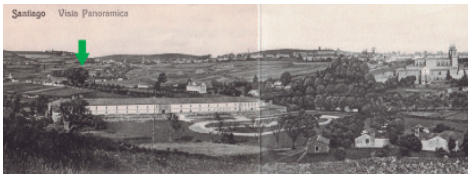
Pormenor dunha vista xeral da cidade co desaparecido cuartel de Santa Isabel en primeiro termo. Á dereita sobresaie a carballeira do convento de San Francisco (desaparecida) e á esquerda (senalada cunha frecha) a de Vista Alegre (Postal, c. 1910.).

Ademais da carballeira, o parque conta con moitas árbores froiteiras, terras de labor (agora con céspede) e xardín. Os carballos ocupan sobre 30 áreas, entre os que non faltan varios pés de gran porte, ordenados en ringleiras, algúns para proporcionar madeira e sombra (no medio hai unha fonte) e outros para decotar para leña.