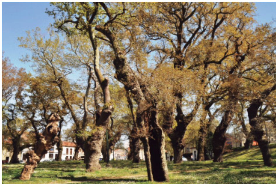
A primavera na carballeira de San Lourenzo.

carvallos, abaixo ‘n a esplanada en que o barrio de San Lourenzo termina, ó ponente d’a monumental cidade (...) Pois bén n’ese trayeuto, non moi grande, cand’un pouco mais a via se franqueaba, un día d’o ano, o luns de pascua d’Sprito Sancto ou de Pentecostés, de madrugada, juntábanse n’ese punt’e sitio cantos marmuradores e rejoubeiros de maor talla e nóta contiña o gran povo de Santiago, para pasar en revista e á coitelo de lingua, ben agudo e afiado, á cantas personas e familias o merecesen, d’as que n’aquela miñan pasaban por aquel penoso estreito par’a romaría de San Amaro, que ‘n o lugar de Barouta, d’a parroquia de San Tomé de Amés... 39