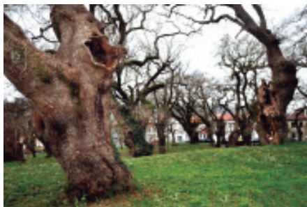
Algúnas árbores centenarias da carballeira de San Lourenzo.