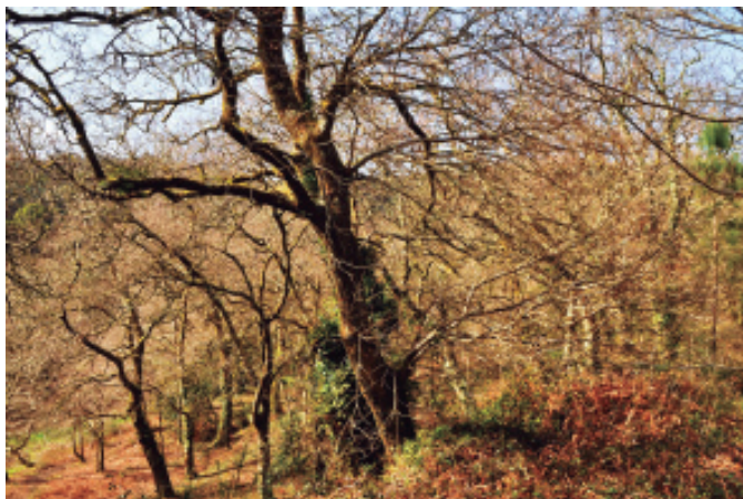
O desleixo dálle á Selva Negra un feitiizo especial todo o ano.