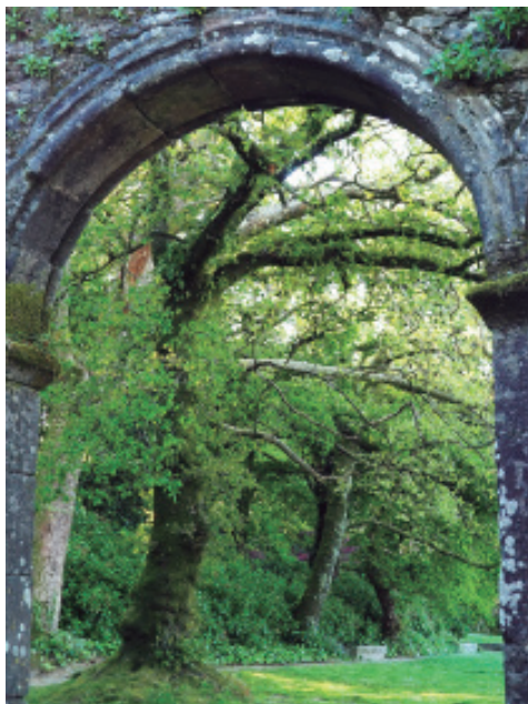
A carballeira de San Domingos de Bonaval dende os restos do antigo claustro do convento.

... Ultimamente se comprende en esta entrega la huerta contigua, del referido Con-