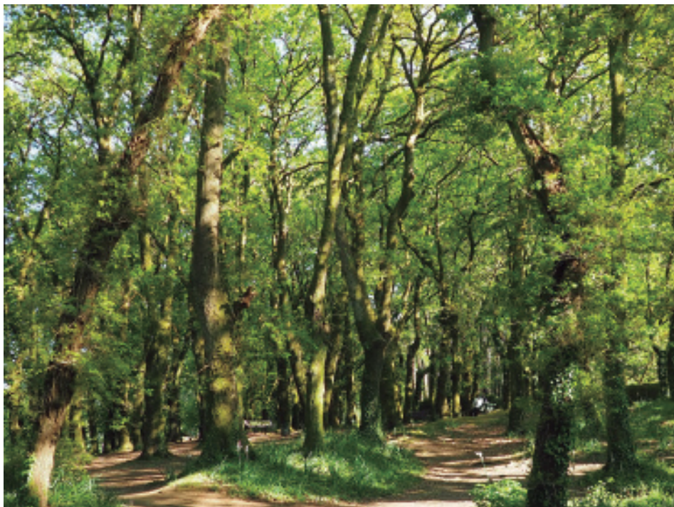
Vista xeral da carballeira do Paxonal.

No mes de maio de 2009 o Concello acordou darlle o nome do cantor portugués José «Zeca» Afonso, en lembranza de que foi aquí, no Burgo das Nacións, onde cantou por primeira vez en público Grândola, Vila Morena , o 10 de maio de 1972, debido a estar prohibido en Portugal o álbum Cantigas do Maio , editado en Francia. Dous anos despois, a súa emisión na radio sería a contrasinal para o comezo da Revolução dos Cravos ou de Abril contra o réxime ditatorial do «Estado Novo» e o comezo da democracia no país veciño.