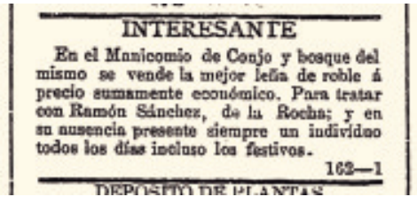
Anuncio de venda de leña de carballo no manicomio de Conxo ( Gaceta de Galicia. Diario de Santiago , 14 de xaneiro de 1892).

Permaneceu así ata que en 2018 empezaron as obras de acondicionamento para converter toda a ribeira do río Sar en parque público, incluída a parte que corresponde á carballeira: abríronse camiños e sendeiros, arranxouse o merendeiro sobre o río, a fonte, etc. Queda por facer a restauración do bosque, para o que cómpre eliminar as especies alóctonas, agás algúns exemplares senlleiros que pola súa antigüidade merezan conservarse, e o resto dedícalo a fraga autóctona, como se fixo coa Selva Negra, recuperando, ademais dos carballos, o bosque de ribeira que se estende ao longo do curso do río Sar.