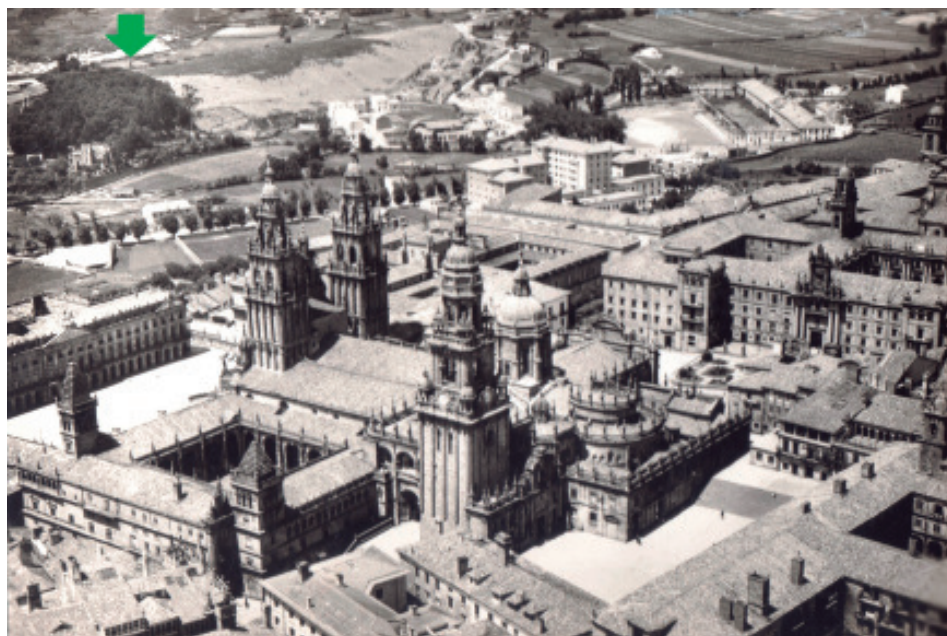
A catedral e a carballeira do Espiño á esquerda (Postal, c. 1960. Colección «Sanxiao - Lodeiro»).