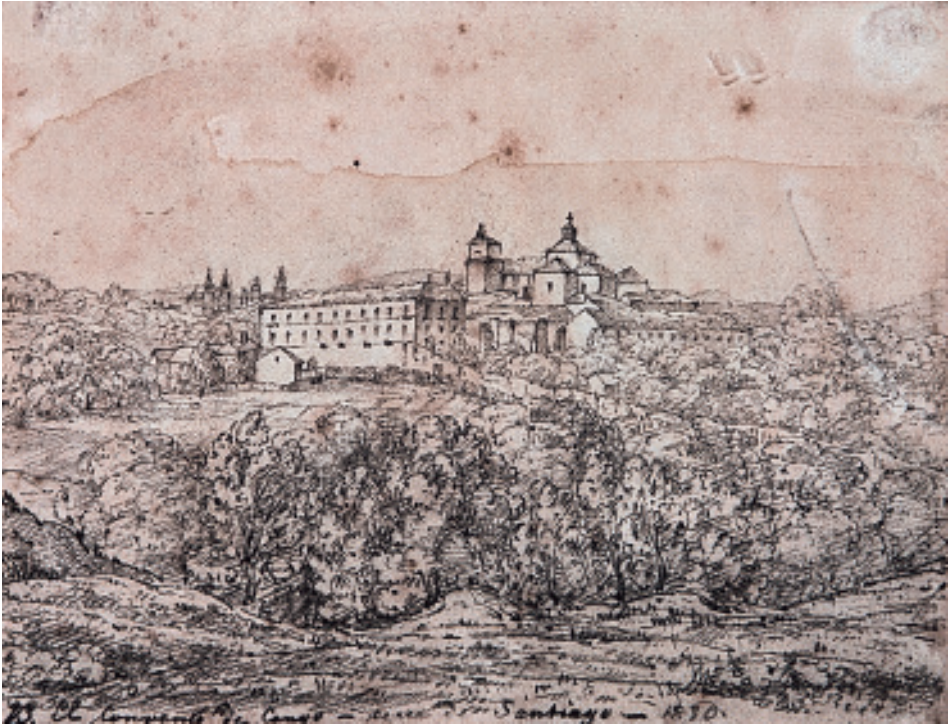
O convento e a carballeira de Conxo antes da desamortización. Debuxo de John Todd, 1830 (Colección particular. Sánchez García, J. A., coord.: Catálogo del patrimonio arquitectónico de la Diputación de A Coruña , 2020).

En lembranza deste democrático xantar o Concello compostelán recuperou o espazo en 2018 para lecer de todos os veciños. Ademais tamén se celebra unha festa anual á que adoitan acudir moitas persoas coa indumentaria propia de mediados do século XIX.