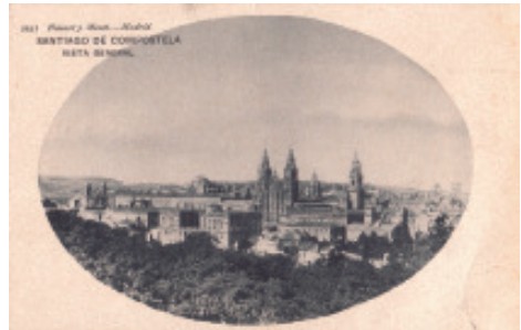
A cidade dende a carballeira de Santa Susana (Postal, c. 1909. Colección «Sanxiao - Lodeiro»).

Non creo que haxa en Compostela un parque público ao menos sen un carballo. Por algo é a cidade galega que conta con máis carballeiras, entre as que sobresaen pola