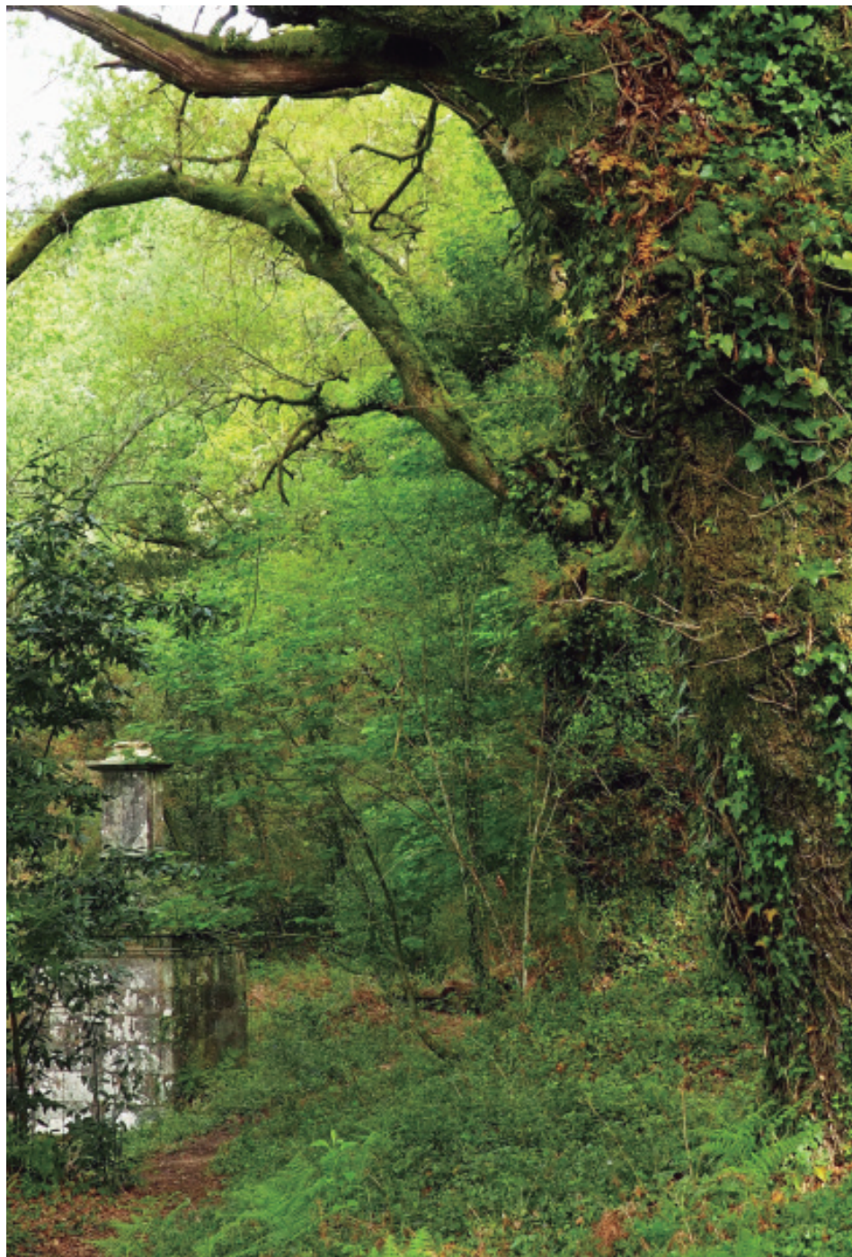
Un romántico recanto da Selva Negra.