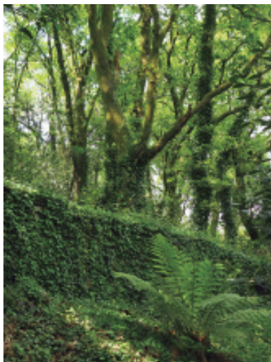
Un recanto da carballeira do parque «Finca do Espiño».

Hai sendeiros para andar por todo o parque, así como bancos para descansar á sombra. O aspecto de desleixo intencionado da vexetación que medra libre, fai que o visitante se sinta como se estivese nunha fraga abandonada, cando queda a pouco máis de medio quilómetro da catedral.