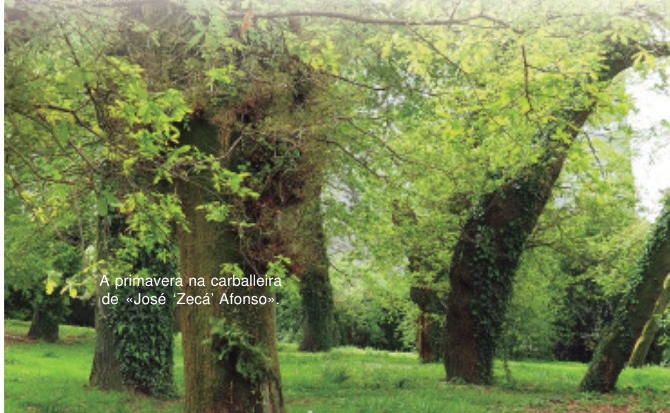
A primavera na carballeira de «José 'Zeca' Afonso».

Comprende un terreo de máis de 30 áreas, con árbores vellas de gran porte e altura, das que varias decotáronse para leña hai moitos anos, pero a «forca» (dúas pólas que lles deixaban), nalgúns casos medraron tanto que case non se aprecia a diferenza entre o tronco e o resto.