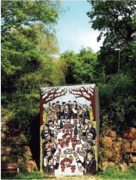
Mosaico conmemorativo do Banquete democrático de Conxo na carballeira onde se celebrou, deseñado por Xosé Vizoso, 2019. Por detrás e aos lados varios carballos centenarios.