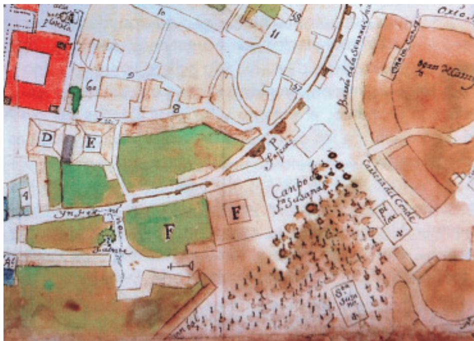
O Campo de Santa Susana e parte da carballeira do mesmo nome (Pormenor do plano de Santiago atribuído a Francisco Ferreiro, mediados do s. XVIII, Instituto P. Sarmiento de Estudios Gallegos).

sexa vez a representación, a carballeira estaba formada por varias ringleiras de árbores que empezaban case fronte ao colexio de San Clemente e se abrían en abano ata rematar no actual paseo da Ferradura.