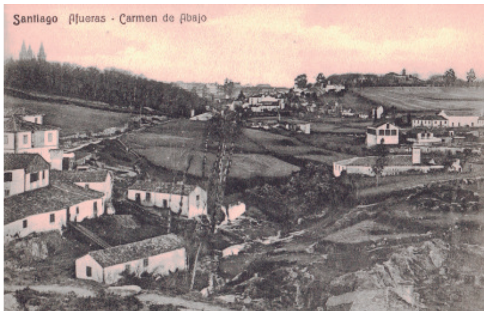
Á esquerda a carballeira do Espiño coas torres da catedral por detrás, e á dereita a de Santa Susana coa igrexa na cima (Postal, c. 1910.).