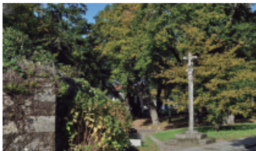
A carballeira de San Lourenzo e o cruceiro de 1683. Á esquerda o muro do antigo convento franciscano de San Lourenzo de Trasouto.

que só conseguiron a casa conventual e o predio cerrado, pero non esta carballeira nin tampouco a de Santa Susana. Para tal demanda baseábase nun acordo entre os relixiosos e un dos condes do 11 de marzo de 1776, no que os primeiros