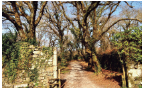
A antiga entrada da Selva Negra con carballos centenarios.