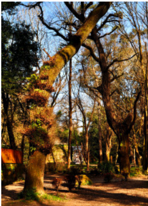
Un recanto da carballeira de Conxo no inverno.