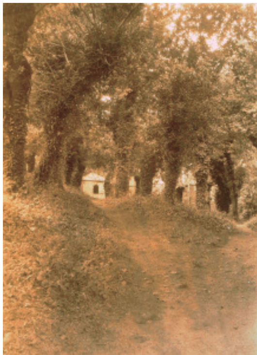
Unha vista da carballeira de San Lourenzo (Postal fotográfica, c. 1905. Colección «Sanxiao - Lodeiro»).

a herdade territorio y mont que esta sita detras do dito Mosteyro contra no Rio y Ponte debaixo do dito Mosteyro segund que agora esta cerrada e valada para a dita debesa y segund que vos os flayres do dito Mosteyro cerrastes e valastes por miña orden e mandado para acrecentar mais a dita debesa da que ja estaba plantada y con mais todos los carballos e arborles que agora estan plantados... 29