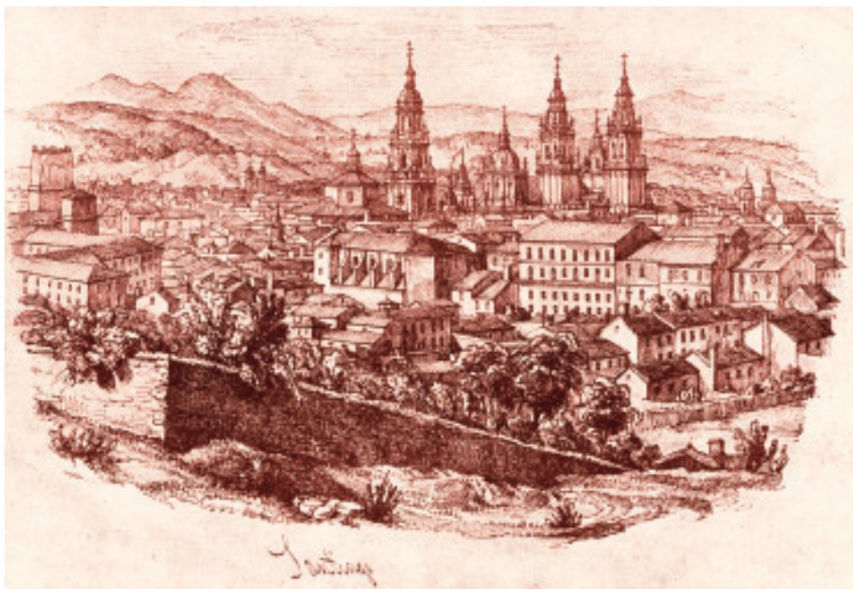
Santiago dende o monte da Almáciga por Ramón Gil Rey, 1842. En primeiro termo o muro e o bosque de San Domingos (Debuxo a pluma, Museo Provincial de Pontevedra).