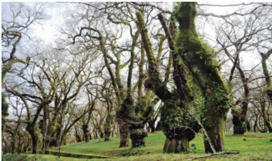
A carballeira de Santa Susana no inverno.

nova de que se puxeran 50 carballos, pero dous anos despois denuncia unha talla indiscriminada 25 .