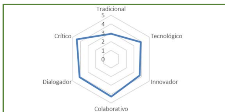
Figura 1. Perfil autodefinido del entrenador mediante el COQ.

La muestra estuvo constituida por 15 sesiones de entrenamiento formadas por 91 tareas desarrolladas por un equipo infantil masculino de ámbito regional, siendo partícipes los 18 jugadores y el entrenador. Todas estas sesiones de entrenamiento registradas por el observador fueron cotejadas con el entrenador para asegurar su correcta categorización. Estas tareas, por tanto, van a estar supeditadas al estilo personal del entrenador, que según su perfil autodefinido obtenido a través del Coach Intervention Questionnaire (COQ) (Feu, Ibáñez, Graça y Sampaio, 2007) destacan los componentes crítico, colaborativo y dialogador al estar por encima de la media (3.89). La experiencia de este entrenador es de nueve años.