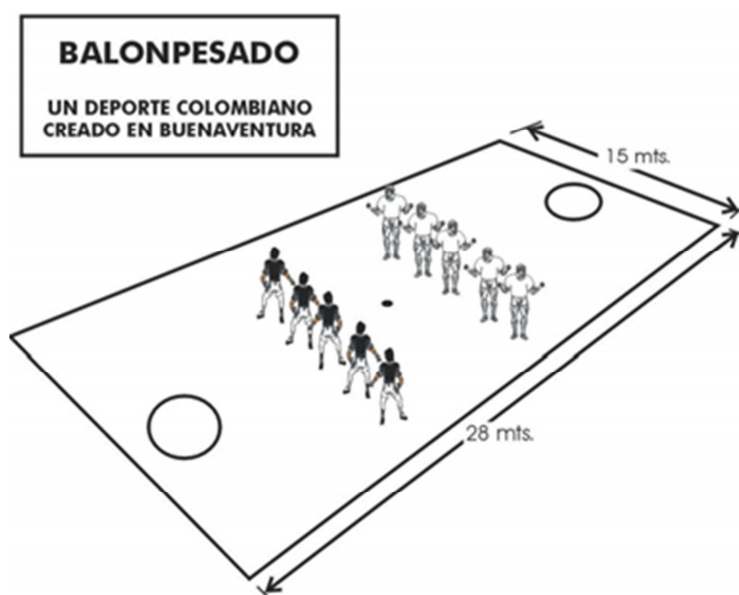
Figura 1. Reglamento de Balonpesado, Versión 21 (2008) Roberto Lozano Batalla https://www.buenaventura.gov.co/images/multimedia/balon_pesado.pdf