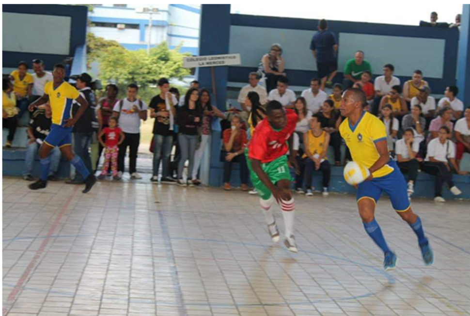
Figura 2. Imagen obtenida de la página de Facebook de la Universidad Santiago de Cali.

En los años siguientes este deporte logró entrar a los Juegos Intercolegiados, Juegos departamentales del Valle del Cauca y Juegos del Litoral Pacífico como deporte de competición. En el año 1994, en la ciudad de Palmira, ubicada en el departamento (Región geográfica) del Valle del Cauca, se creó la Liga Vallecaucana de esta disciplina que luego se trasladó al Distrito especial de Buenaventura y estuvo vigente hasta el año 2018, siendo ésta la primer y única liga de balonpesado en Colombia y la cual es responsable de la creación del acuerdo N°05 de 2009 del Concejo Distrital de Buenaventura mediante el cual se reconoce a este deporte como patrimonio cultural y deportivo del distrito (Entidad territorial organizada). Esta disciplina estuvo presente en dos juegos mundiales en calidad de deporte de exhibición como lo fue el Mundial de TAFISA disputado en Bogotá-Colombia en el año 1994 y en los World Games realizados en Cali-Colombia en el año 2013.