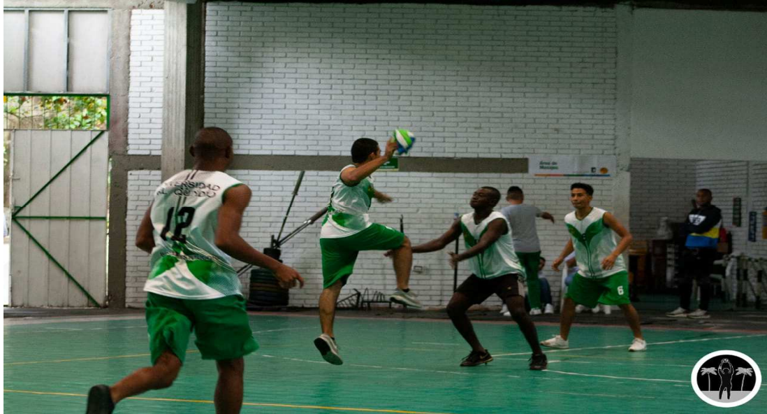
Figura 5. Imagen obtenida de la página de Instagram del Club Balonpesado Herencia.