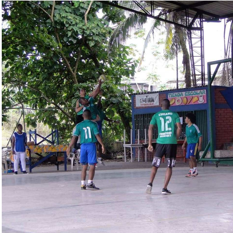
Figura 6.

“La ilusión más grande, es poder lograr lo que alguna vez soñamos” Jose Francisco Mora Núñez 07-05-2021