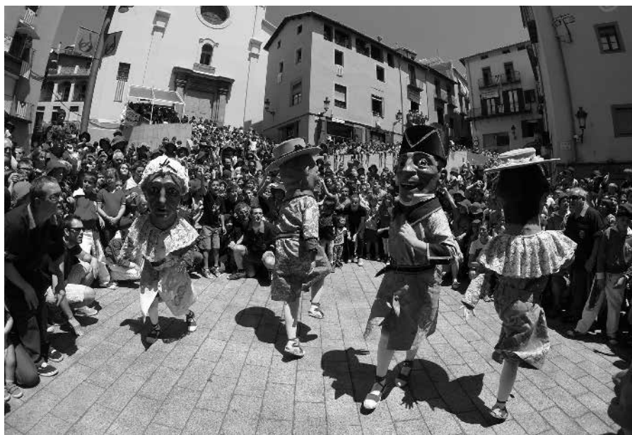
Els Nans Nous de La Patum infantil, verdadera escuela de patumaires