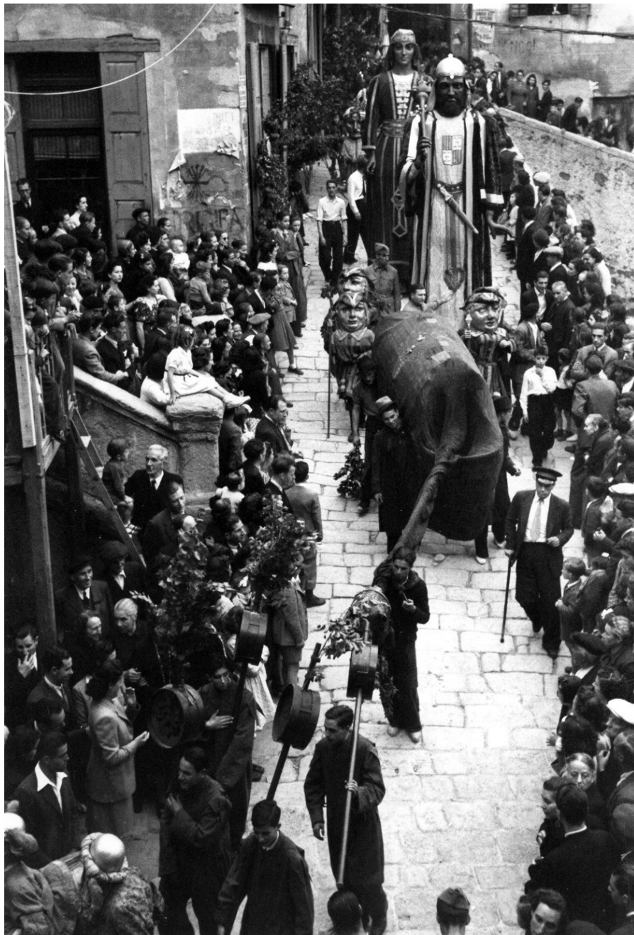
Procesión de Corpus de 1943