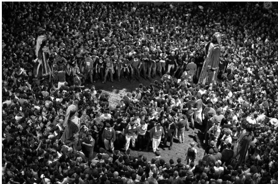
Baile de los Gegants en La Patum completa