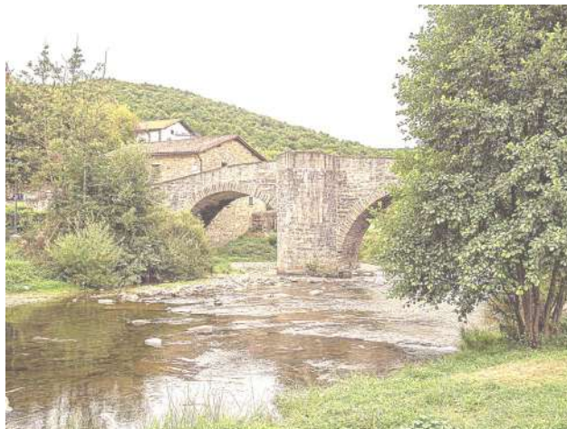
Puente de la Rabia, Zubiri.

Antigua villa de señorío realengo cuyos vecinos debían a título de "cazadores" una pecha anual (1427) de 30 sueldos más 10 cahíces de avena. Quizá estaba en su término el "monasteriolo" dado por el rey García Sánchez el de Nájera (1040) a la abadía de Leire. Santa María de Roncesvalles adquirió (1382) el molino del lugar.