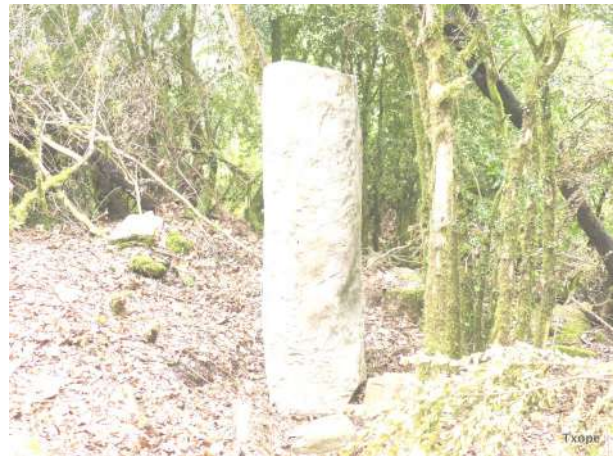
Miliario Romano de Esteribar.

Recientemente se ha localizado en el valle de Esteribar un Miliario Romano que indica el paso de un ramal de la Vía XXXIV que aparece en el Itinerario Antonino A34, la Ab Asturica Burdigalam (Astorga-Burdeos) que discurría por los cercanos Valles de Arce y Erro como certifican los recientes hallazgos arqueológicos realizados en los vecinos valles. Esta vía fue también conocida en la Edad Media