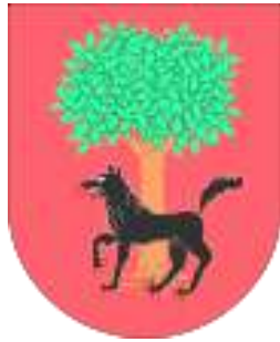
Escudos de Esteribar: antiguo y actual.

En la Edad Media se le conocía como "Valle de los cazadores" por los privilegios que sus habitantes tenían sobre la caza. Sus habitantes vivían de la agricultura, de la ganadería y de la explotación forestal. Aunque la mayor parte de los habitantes eran pecheros, que debían pagar tributos al rey o al Monasterio de Roncesvalles, en algunos pueblos había hidalgos nobles, habiendo quedado como testimonio de su presencia algunos palacios y casas solariegas que se conservan en el valle.