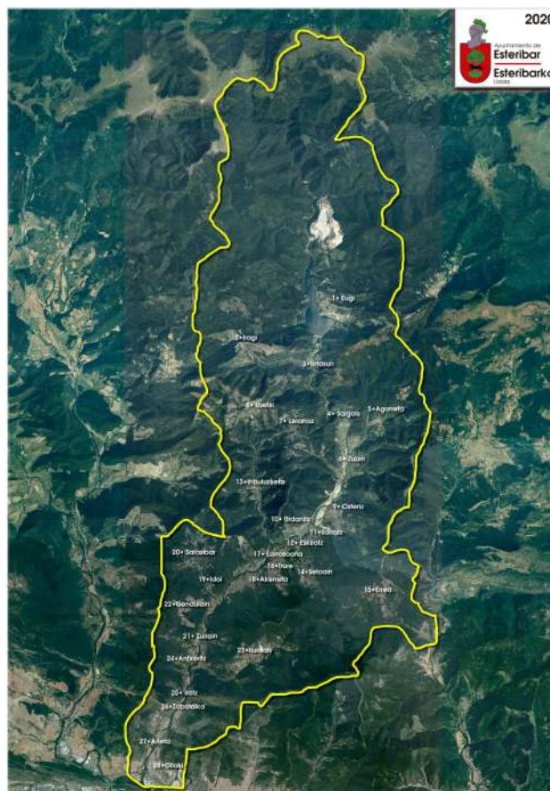
Mapa de Esteribar.

El antiguo escudo de Esteribar coincidía con el blasón de los cazadores del valle debido a la importancia que en la Edad Media tenían los privilegios y tributos que los cazadores debían al rey. Consistía en un castillo de oro con