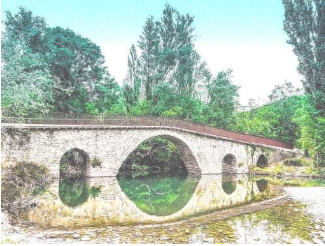
Puente de Iroz.

para el esparcimiento que recorre la orilla del río. Recorrido preparado para peatones y ciclistas que une agua y vegetación, un corredor verde, refugio de la vida natural, que nos guiará a través de puentes históricos, presas, molinos, granjas y huertas de Pamplona y comarca.