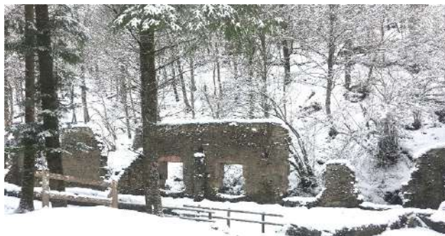
Ruinas de la Fábrica de municiones de Eugui.

En el aspecto del ocio deportivo, se ha creado una red de rutas que ha tenido una excelente acogida entre los aficionados, tanto a nivel nacional como internacional. La práctica de senderismo es muy habitual en el valle, bien sea por los propios vecinos o por aquellos visitantes que se acercan desde la capital navarra o desde otros lugares. Actividades como el trailrunning, cicloturismo, BTT, senderismo, micología, tour fotográfico, baños de bosque, observación de flora y fauna... Existen infinidad de rutas aptas para todo tipo de niveles y además se pueden compaginar con visita a diferentes Dólmenes como los de Bayarnegui en las inmediaciones de Iragui o Armaya en la ladera del monte Baratxuetta.