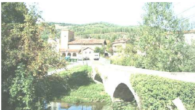
Puente de los bandidos, Larrasoña.

Villa cuyo origen se atribuye al monasterio de San Agustín de Larrasoñain (Larrasoña), fundado al parecer en el siglo X e incorporado al de Leire en el siglo XI., Larrasoña fue una de las 30 poblaciones navarras que siguieron teniendo derecho a asiento en las cortes castellanas. Fue municipio independiente hasta 1928, año en el que se integró en el de Esteribar. Por ser punto de reunión de los peregrinos, hubo en este pueblo tres hospitales. El más antiguo fue el del monasterio de los Religiosos Agustinos, propiedad de la colegiata de Roncesvalles, el de la cofradía de Santiago y el de San Blas.