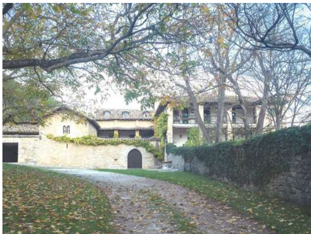
Señorío de Arleta.