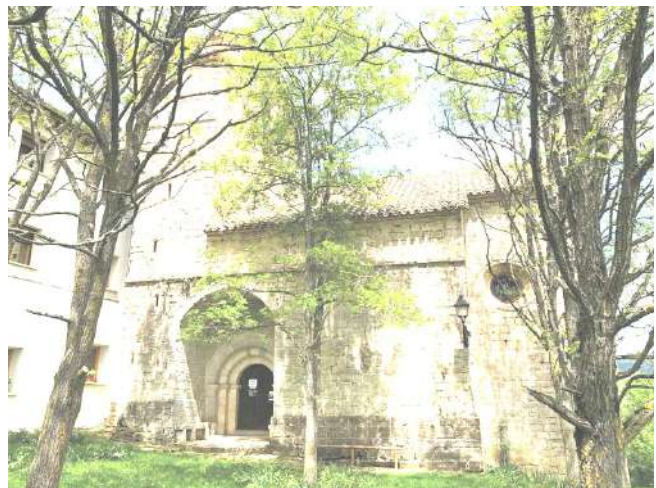
Iglesia de Zabaldika.