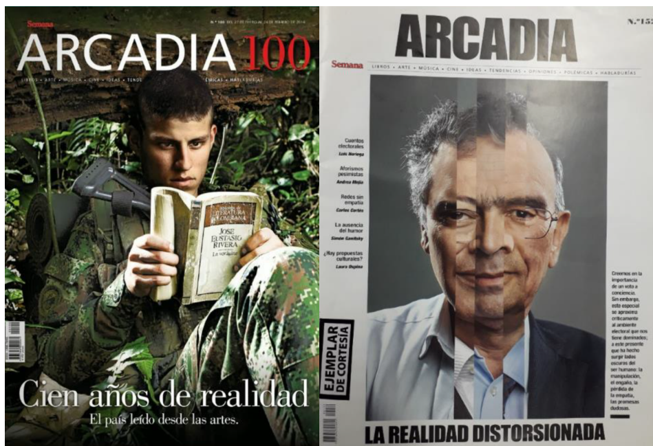
Figura 1. Portadas de Arcadia