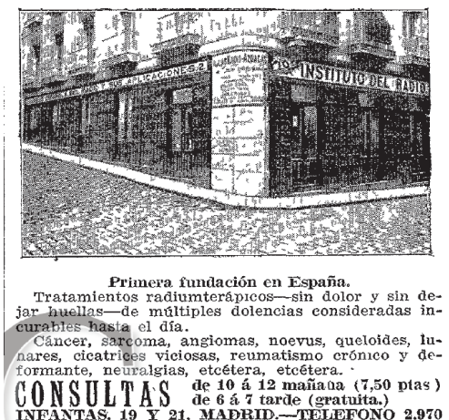
Foto 4: Anuncio publicitario Instituto del Radio .

El Instituto Radiumterápico de Madrid, incluye tres veces de octubre a noviembre de 1910 un nuevo anuncio simplificado, informando de las enfermedades que pueden ser curadas mediante el Radium , únicamente en sus instalaciones.