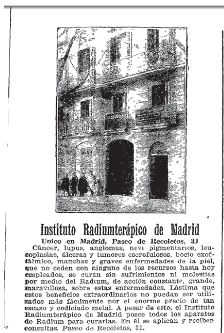
Foto 3: Anuncio publicitario Instituto Radiumterápico de Madrid .

El siguiente anuncio apareció publicado tres veces en junio de 1910. Se destaca el mensaje que se quiere transmitir en la última frase: “En él se aplican y reciben consultas sin los enormes gastos para los enfermos que generalmente exigen las intervenciones quirúrgicas.” Se trata del mismo texto que otros anuncios, con alguna variación en el texto, y adicionalmente se indica que un solo gramo de radium cuesta 400.000 francos.