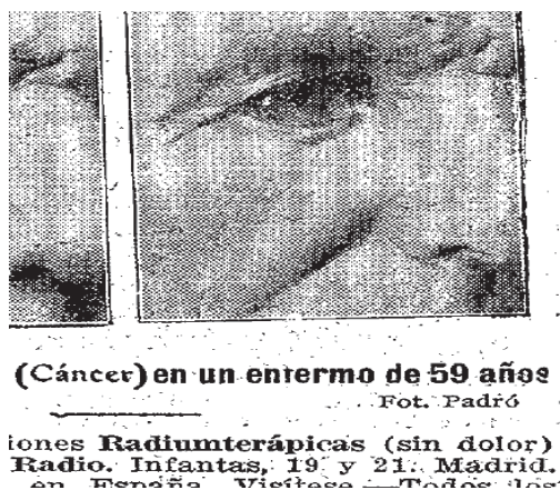
Foto 2: Anuncio publicitario Epitelioma ulcerado en un enfermo de 59 años.

Asimismo, en 1910 aparece publicitado tres veces dicho establecimiento, aunque llama la atención la fotografía de un paciente de 59 años con un epiteloma ulcerado, y una fotografía posterior tras ser tratado con radio, indicando la bonanza del tratamiento a través de la imagen.