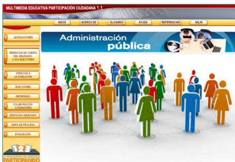
Figura 2. Interfaz inicial de la multimedia educativa de participación ciudadana.

del contenido, para alcanzar la formación esencial en su vínculo con la realidad sobre la cual actúan los servidores públicos, por lo que se agrupan en ella los elementos de la participación ciudadana cubana, se satisface una necesidad de aprendizaje de los actores del gobierno y la administración pública en general.