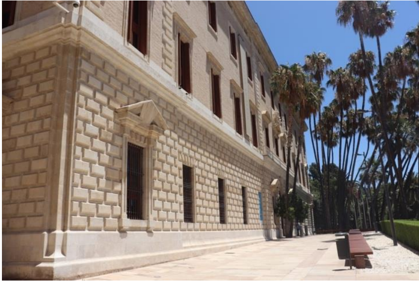
Fig. 1. Vista del Palacio de la Aduana, en la actualidad Museo de Málaga, elaboración propia, 2020.

El Museo de Málaga, en la actualidad de titularidad estatal y gestión autonómica, presenta un currículum histórico tremendamente personal, pero, al mismo tiempo, con paralelismos con el resto de museos andaluces tanto en lo que respecta a su conformación como en lo que concierne a su historia más reciente.