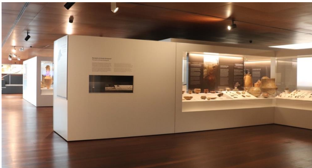
Fig. 2. Vista de diversas salas de la sección de arqueología del Museo de Málaga, elaboración propia, 2020.

« ...ocho bloques expositivos, que se iniciaba en torno a las primeras colecciones arqueológicas de aficionados burgueses decimonónicos, específicamente aquellas reunidas por los marqueses de Casa-Loring en Málaga y de Salamanca y Madrid [...] Le seguían dos bloques concomitantes destinados a la presentación del más remoto pasado provincial en las entrañas de la tierra, con los bienes culturales escritos a la Prehistoria en las numerosísimas cuevas malagueñas. El primer bloque, y el destinado a transitar entre tumbas de gigante como metafórico modo de presentación del fenómeno del Megalitismo y el final de la Prehistoria en la provincia malagueña, el segundo [Fig.2] . El especialmente convertido como recurso museográfico por la Tumba del Guerrero, se destinaba a la presentación del período entre Maniate y Malaka, la búsqueda de griegos y fenicios en el litoral malagueño, bloque muy extenso por su especial presencia y su singularidad en nuestra provincia.» (Palomares, 2018, p.382).