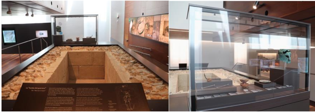
Fig. 5. A la izquierda: Vista de la estructura de la Tumba del Guerrero en el Museo de Málaga tras las modificaciones que supuso sobre la original su traslado y disposición en la segunda planta del Museo, elaboración propia, 2020. A la derecha: Detalle de la vitrina en la que se dispone el ajuar hallado en Tumba del Guerrero en el Museo de Málaga, elaboración propia, 2020.

Por último, la difusión del hallazgo, así como la presentación de elementos no expuestos, se realiza mediante la inserción de fotografías en un panel retroiluminado que discurre horizontalmente en paralelo a la tumba y la disposición de la información en el atril bajo este. A ello habría que añadir la disposición de una pantalla, que hace tiempo dejó de funcionar y que esperamos se encuentre activa en un futuro, en la que se explica la trayectoria del bien desde su hallazgo.