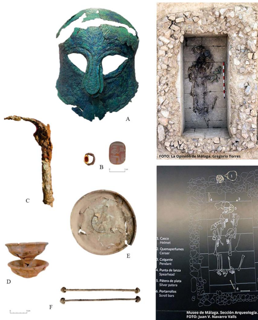
Fig. 7. A la izquierda: conjunto de ajuar de la tumba del guerrero tras el proceso de restauración de las piezas A, B y C. A la derecha: arriba, vista cenital de la tumba durante el proceso de excavación y abajo, dibujo arqueológico con la disposición in situ de las piezas que componen el ajuar. Elaboración propia, 2020 a partir de la Fig.6 en García González et alii , 2012 y Navarro Valls, en línea.

cambios sociales y, en segundo lugar, a partir de la actualización de las investigaciones, pues ambas cuestiones modifican tanto la demanda de información como la fórmula de difusión. Por tanto, lo que en este apartado venimos a precisar es una propuesta de mejora motivada por estos cambios y no por la propuesta expositiva vigente que fue producto de sus circunstancias y que permitió salvar y difundir uno de los hallazgos más destacados realizados en Málaga. A pesar de que se realizó una importante labor, la publicación del estudio completo y el tiempo que ha pasado desde la propuesta, invita a una reordenación museográfica que permita devolver y acercar los nuevos datos a la sociedad a pesar de ser conscientes de que quizá, todo ello sea, al menos por el momento, debido a cuestiones eminentemente económicas, museografía imposible. [Fig. 7]