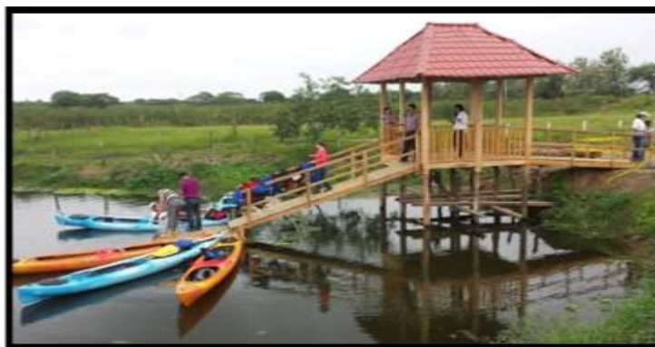
Proyecto vinculación 2017 Autores: Estudiantes de Hotelería y Turismo