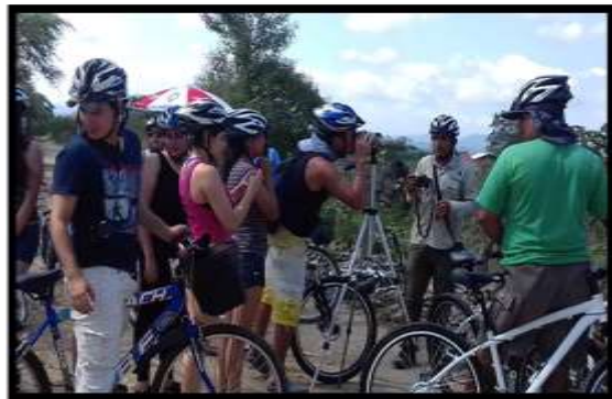
Proyecto vinculación 2017 Autores: Estudiantes de cuarto nivel de Hotelería y Turismo