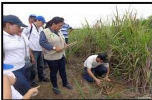
Proyecto vinculación 2017 Autores: Estudiantes de Hotelería y Turismo