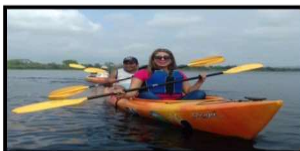
Proyecto vinculación 2017 Autores: Estudiantes de cuarto nivel de Hotelería y Turismo