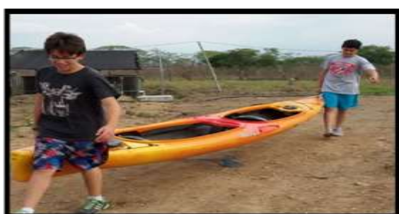
Proyecto vinculación 2017 Autores: Estudiantes de cuarto nivel de Hotelería y Turismo