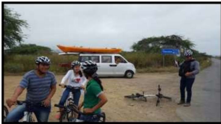
Proyecto vinculación 2017 Autores: Estudiantes de Hotelería y Turismo