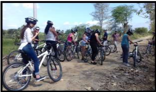
Proyecto vinculación 2017 Autores: Estudiantes de cuarto nivel de Hotelería y Turismo