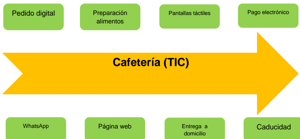
Diagrama BMP de la situación deseada.