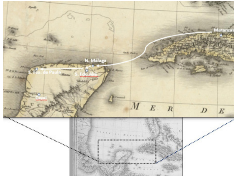
Mapa 1. Mapa de parte del Caribe, indicando el derrotero entre los sitios de Matanzas, Cuba, Nueva Málaga, San Fernando Aké y San Francisco de Paula

Fuente: detalle del mapa Unites States. West Indies , realizado por P. Tardieu, P. Lapie y C. Piquet, 1806. Recuperado de https://www.reddit.com/r/MapPorn/comments/2qt5oj/an_1806_map_of_the_united_states_and_west_indies/ Editado por Alejandro Molina E.