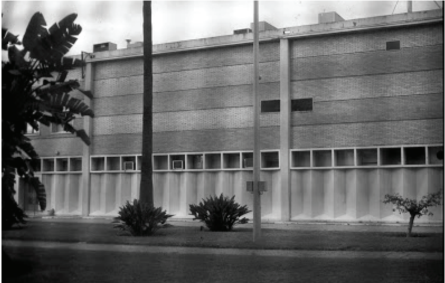
Figura 3 Fábrica de Citesa antes de su demolición

Ca. 2009 (Del Pino & Santana. 2009-09-13).