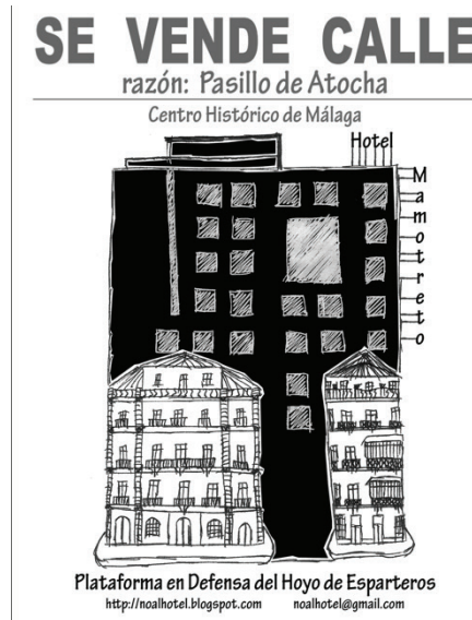
Figura 4 Cartel del manifiesto en defensa del Hoyo de Esparteros y La Mundial

ña, lo que abrió una nueva opción de trabajo: la realización del denominado I Encuentro en Defensa de la Ciudad y el Patrimonio (EDCP) en Málaga en octubre de 2011. A él acudieron diversas asociaciones y plataformas de otras provincias para dar visibilidad a sus problemas (Figura 5).