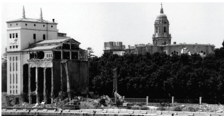
Figura 2 Demolición del Silo del puerto. 2006-05-24