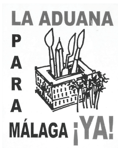
Figura 1 Logotipo y lema de las manifestaciones a favor de la Aduana

Sin lugar a dudas estas acciones sucedieron porque el residente se sintió plenamente identificado con sendas colecciones expositivas, pues las consideraba su herencia y por lo tanto algo propio, tal y como lo es. Desafortunadamente, este acontecimiento, el más sobresaliente en el que la ciudadanía malagueña ha mostrado su interés y preocupación por su patrimonio, no ha vuelto a producirse ni a tal escala ni con tanta intensidad.