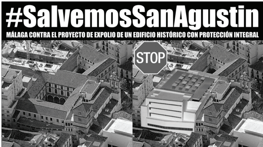
Figura 6 Imagen utilizada en Change.org con el hashtag #SalvemosSanAgustin (Edificios, 2018)

Tanto en el tema del Hoyo de Esparteros como en el del Convento de San Agustín, el uso de las redes sociales conllevó la creación de diversas etiquetas o hashtags . En primer lugar #SalvemosLaMundial, que posteriormente fue sustituida por #RIPLaMundial y por #RecuerdaLaMundial; aún hoy estas se usan en relación a situaciones de peligro del patrimonio malagueño; y en segundo lugar #SalvemosSanAgustin.