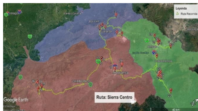
Figura 5. Ruta Sierra Centro.