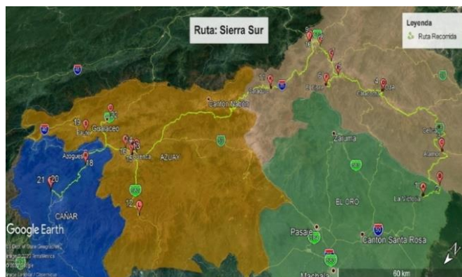
Figura 6. Ruta Sierra Sur.