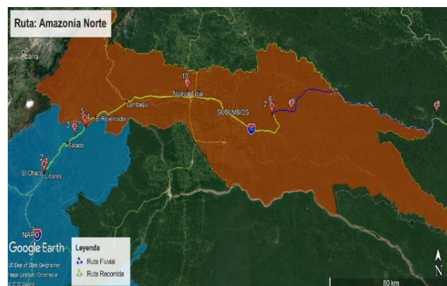
Figura 7. Ruta Amazonía Norte.