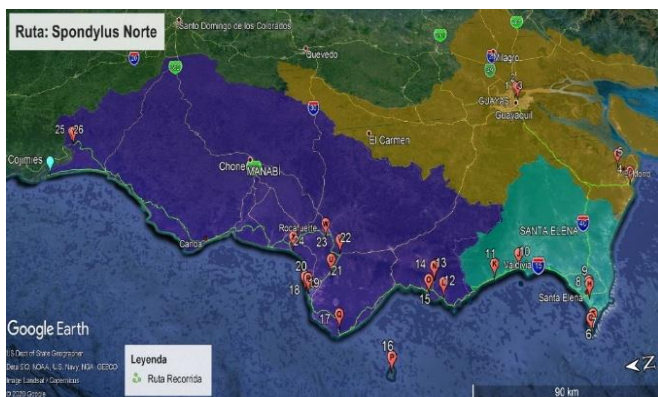
Figura 10. Ruta Spondylus Norte.