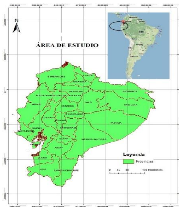
Figura 1. Ecuador Continental.

Se diseñaron nueve rutas turísticas alternas que los turistas pueden visitar en el Ecuador Continental. Entendiendo que las rutas turísticas como parte de la oferta turística de un destino, contribuyen a los objetivos de distribuir la demanda a lo largo de todo el año, por todo el territorio y responden a las necesidades de los mercados emergentes, que basan sus exigencias en la necesidad de los viajeros, que buscan un enriquecimiento de su experiencia, flexibilidad, descubrimiento, aprendizaje y contacto con los pueblos y tradiciones (MINTUR, 2018a,b). En la figura 1 se representa un mapa con las áreas de estudio.