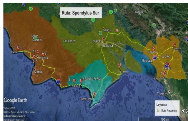
Figura 11. Ruta Spondylus Sur.

Se presentan 9 itinerarios turísticos con su respectivo mapa que identifica claramente el recorrido que se realizó para el levantamiento de la información y consolidación de las rutas turísticas alternas, con la