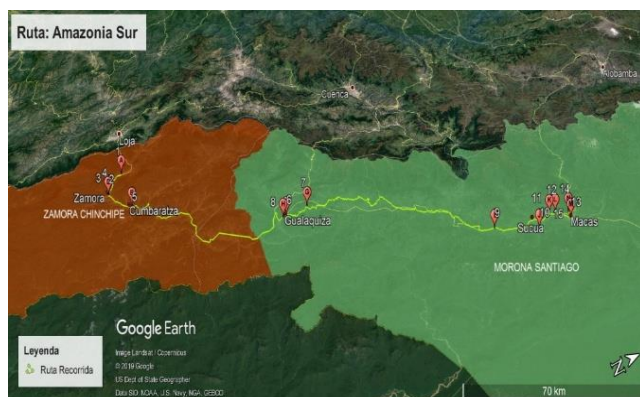
Figura 9. Ruta Amazonía Sur.

Día 5 07h00 Desayuno en Cojimíes 08H00 Traslado hacia Mache - Chindul