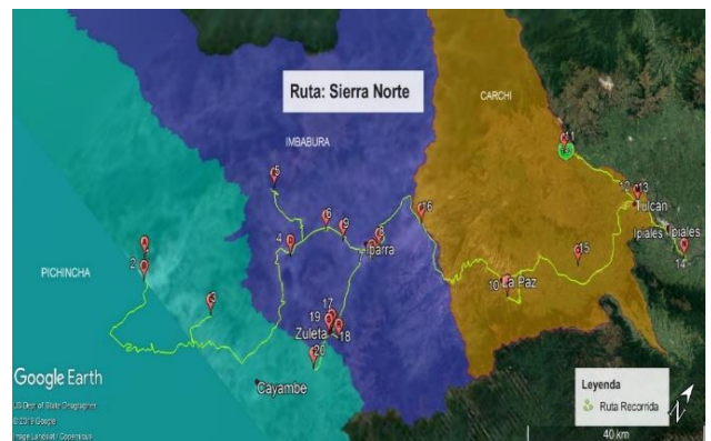
Figura 4. Ruta Sierra Norte.