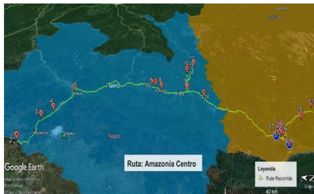
Figura 8. Ruta Amazonía Centro. Fuente: Gira académica carrera de Turismo (2019).