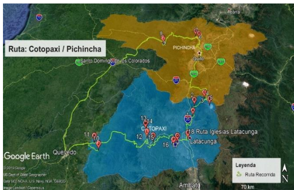
Figura 3. Ruta Cotopaxi/Pichincha.