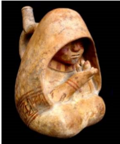
Botella Moche I-II representando a una curandera con manto en forma de pallar, que lleva en sus manos semillas de alguna planta sagrada (Franco, 2012).