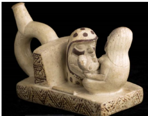
Botella Moche I de caolín representando un acto de curación a cargo de la maestra pallar (Franco, 2012).

Se encontraron, el esqueleto de tres acompañantes, entre ellos una adolescente estrangulada, junto a ella el ceramio de una curandera moche, una mujer con un manto tipo pallar, estaba imponiendo con una mano en el ombligo de una niña sujeta por su madre; esta escena, para el arqueólogo, representaría la infancia de la Dama de Cao.