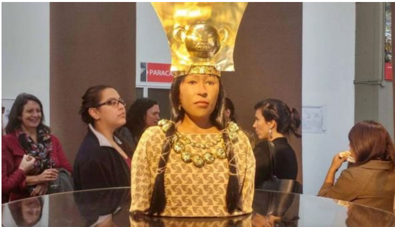
Reconstrucción facial de la Dama de Cao en base al procesamiento criminalístico y la tecnología 3D.

Contrariamente, el Ministro de Cultura Salvador del Solar resaltó que "Ahora tenemos el privilegio de anunciar esta extraña combinación entre el futuro y el pasado: la tecnología nos permite ver el rostro de una líder política, religiosa, cultural del pasado" (Entrevista realizada por la BBC Mundo, julio del 2017).