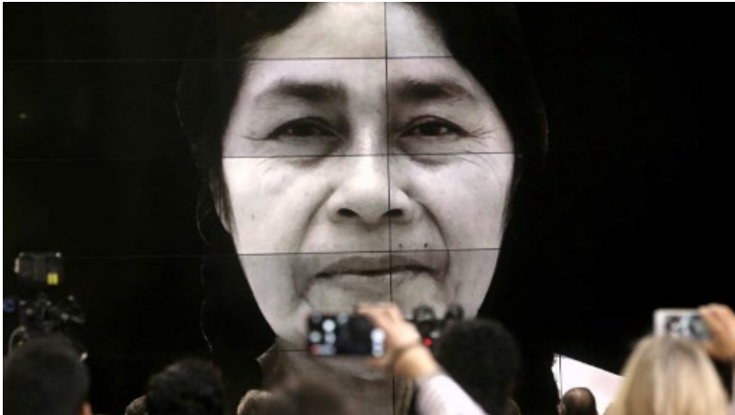
Reconstrucción del rostro realizada por los arqueólogos del Complejo Arqueológico "El Brujo", la Fundación Wiese y FARO Technologies.